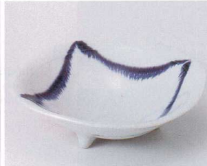
ツ043-10 四方均窯5.0鉢 φ15.8×4.5cm 620円