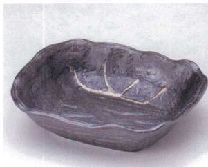
ミ043-13 黒釉白流し長角深鉢 18×15.6×5cm 600円