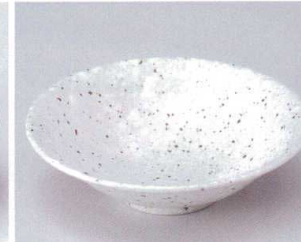
モ043-16 鉄粉白粉引5.5平鉢 φ18×5cm 520円