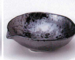
モ043-04 油敵天目片口平鉢 17×16×5cm 670円