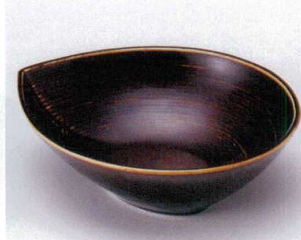
ア043-02 琥珀千段鉢 17×14.6×5cm 680円