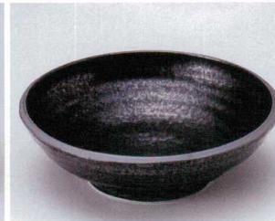
ハ043-15 黒水晶荒引浅鉢 φ16.8×5.2cm 530円