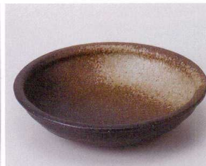
カ043-18 黒備前玉洩5.0平鉢 φ16.8×3.7cm 500円