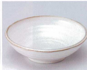
ハ043-14 粉引荒引浅鉢 φ16.8×5.2cm 530円