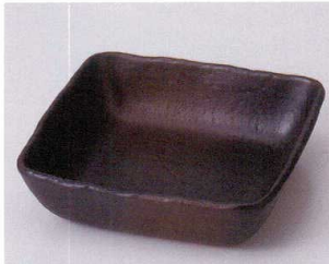
カ043-09 備前風切立14cm鉢 14×14×3.7cm 630円