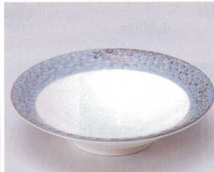
ア043-06 石目平鉢 φ18.5×4.5cm 650円