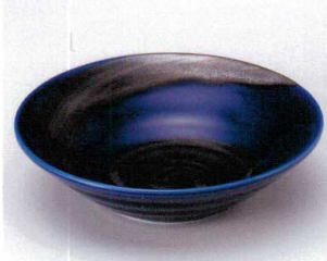
カ043-01 銀彩ブルーリップル5.0鉢 φ16.7×4.5cm 650円