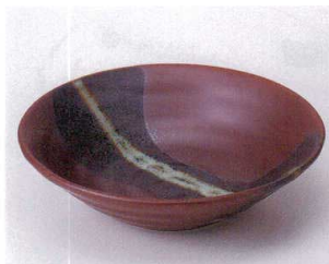
ア043-17 朱華向付 φ16.5×4.5cm 500円