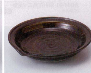
ネ043-08 黄河片口5.0深皿 φ17×3.4cm 630円