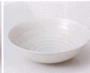
カ043-19 いこい5.0寸鉢 17.6×5.3cm 430円