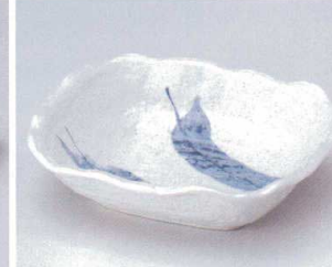
ミ043-12 そよ風長角深鉢 18×15.6×5cm 600円