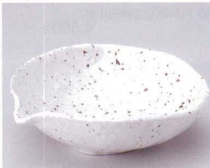
モ043-05 鉄粉白粉引片口平鉢 17×16×5cm 670円