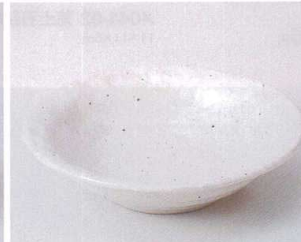
ネ043-07 新粉引石目向付 φ16.5×4.2cm 650円