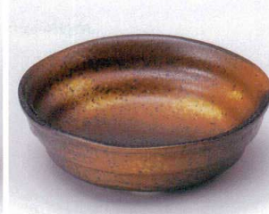
タ043-03 黒備前5.0鉢 φ16×5cm 680円