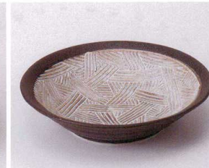
ホ043-20 櫛目紋5.5向付 φ16.8×3.8cm 330円