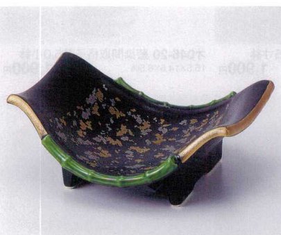
ト045-10 舟型金銀ちらし小鉢 15.3×12.3×5.8cm 2,500円