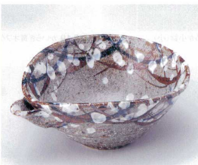
ミ045-11 むさし野片口小鉢 17×13.8×7cm 2,300円