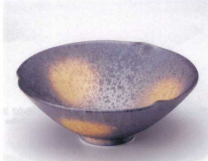
マ045-03 黒ゆず結晶金彩三方なぶり小鉢 14.5×5.5cm(有田焼) 2,900円