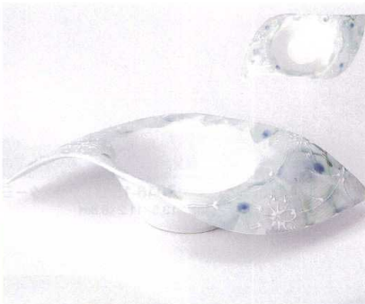
ツ045-08 染付一珍風車型小鉢 28×12×5.7cm 2,500円