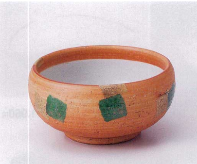
ネ045-07 金銀彩丸小鉢 φ11.5×6cm 2,600円