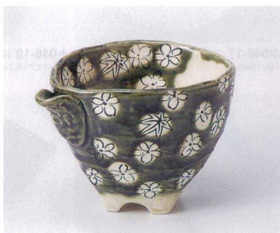
ツ045-12 織部春秋片口新小鉢 14.2×10.7×9.3cm 2,250円