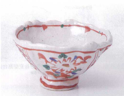
オ045-02 御本手間取小花変形5.0小鉢 15.5×14.5×8.5cm 3,050円