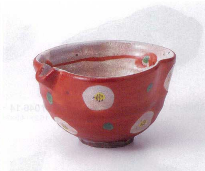
オ045-09 志野釉赤巻梅ちらし片口小鉢 13.7×12.3×7.8cm 2,500円