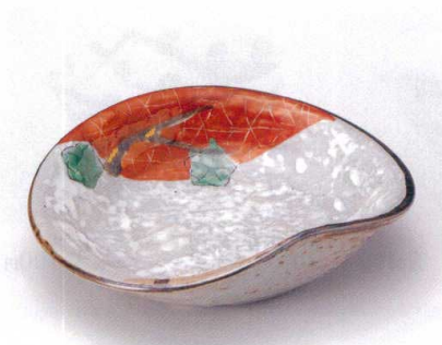
カ045-01 粉引雲錦刺身鉢 16.6×14×5.2cm 3,300円