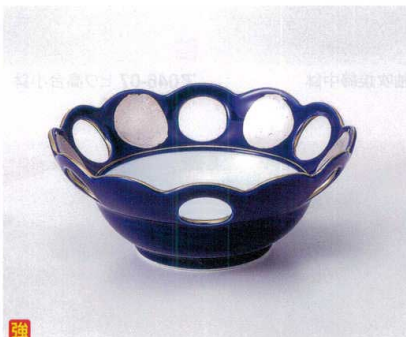
ツ045-05 波型六ツ透し4.5小鉢 φ13.4×5.4cm 2,650円