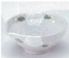
オ052-22 白椿片口小鉢 14.5×13.7×6.2cm 860円