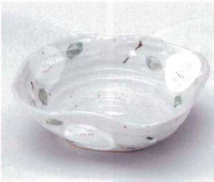
オ052-08 白椿なぶり平鉢 13.9×13.7×5.3cm 980円