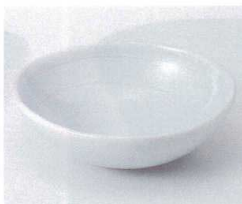
コ052-27 やよい玉型鉢 13.8×12.7×4.2cm 790円