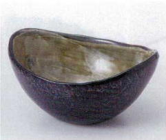
ネ052-19 窯変楕円鉢 14.3×11.3×7cm 840円