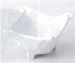
タ052-03 青白磁ちぎり小鉢 12×10.5×7.7cm 1,100円