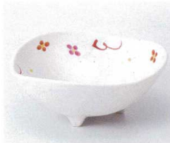
ト052-16 花ちらし三ツ足4.5鉢 14×6cm 780円