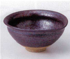
ネ052-13 ひずみ碗錆油滴 φ13×6.2cm 950円