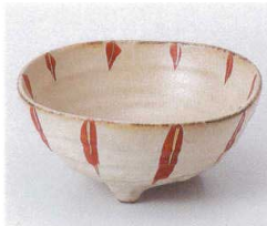
カ052-11 赤金十草三ツ足4寸鉢 13.2×5.9cm 930円