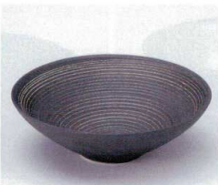
モ052-23 チョコウス反小鉢 φ14×4.3cm 850円