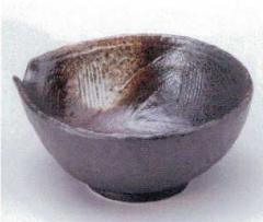
モ052-18 白吹天目片口深鉢 14×13.5×6.5cm 830円