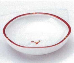
マ052-20 錦小花 小鉢 13.5×4cm(有田焼) 850円