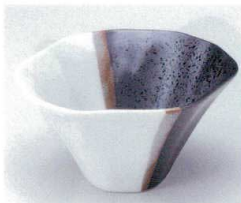
コ052-21 塗分朝顔型小鉢 φ11.8×6.3cm 870円