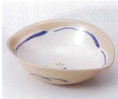
ア052-07 草花中鉢 14.6×12.7×4.5cm 950円