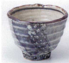
ツ052-01 祥瑞3.5深鉢 φ10.6×7.8cm 1,100円