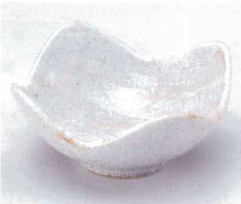
テ052-09 粉引刷毛目四つ山小鉢 12.5×12.5×6cm 950円