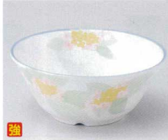
フ052-02 ほのか13.5cmボール φ13.5×5.6cm 1,000円