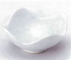
チ052-10 かいらぎ白釉四つ山小鉢 12.5×12.5×6cm 950円