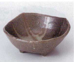
ミ052-25 黒潮小鉢 13×13×5.4cm 800円