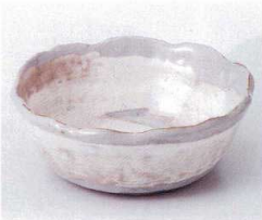
ウ052-04 御本粉引丸小鉢 φ13×4.8cm 930円