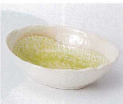
ホ052-28 若草小判小鉢 15.5×11.7×4.5cm 800円