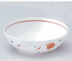
ア052-24 色絵草花だ円鉢 小 14.5×12.7×4.7cm 800円