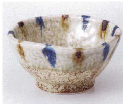
ト052-06 二色流し角小鉢 φ12×6cm 900円