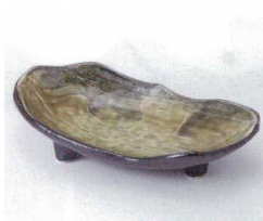
ネ052-12 窯変黒叩三ツ足小鉢 18×9.5×5cm 945円