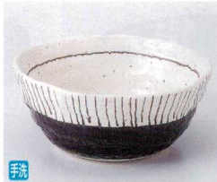
キ052-17 黒釉錆十草変形鉢(中) φ12×5.5cm 850円