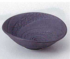
ウ052-30 黒伊賀ウス小鉢 13.6×12.6×4.6cm 730円