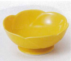
テ052-15 やまぶき梅型高台 φ12.5×5cm 860円