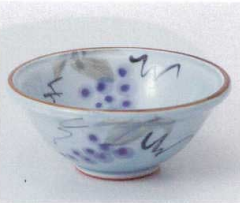
ミ052-05 手書きぶどう玉淵小鉢 φ12.8×5.5cm 930円