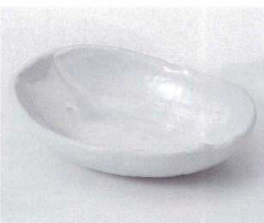
ネ052-29 化粧刷毛楕円鉢 15×11.1×3.7cm 700円