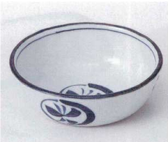
コ052-14 丸紋蝶4.5ボール φ13.5×4cm 890円