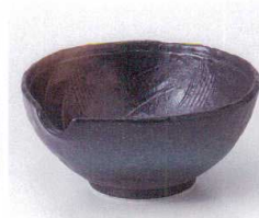
ヤ053-09 黒備前金茶吹片口深鉢 φ14×6.3cm 710円