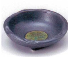
ネ053-07 錆ひねり5.0鉢 φ14.5×5.5cm 700円