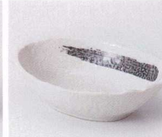
オ053-15 粉引刷毛目楕円小鉢 15.7×11.6×4.5cm 690円