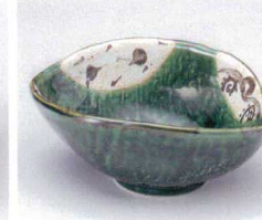
イ053-11 里山織部変型小鉢 15×11.5×6cm 750円