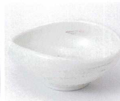
ト053-25 粉引たまご型4.0小鉢 14×11.7×5.7cm 600円