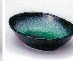
タ053-17 エメラルドグリーン楕円小鉢 15.8×11.4×4.5cm 680円