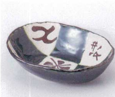
タ053-12 織部格子楕円鉢 15×12.2×4cm 720円