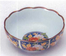
マ053-06 金襴手古伊万里小鉢 13×5cm (有田焼) 750円