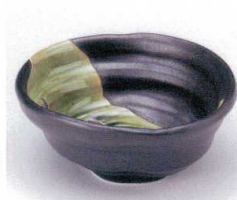
イ053-24 織部流し小鉢 13.8×12.1×5.8cm 630円