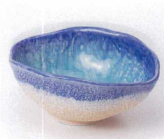
ミ053-01 彩器行変型小鉢 15×11.8×6cm 780円