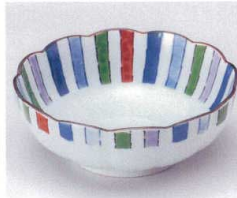
マ053-19 錦十草小鉢 13×5cm (有田焼) 650円