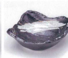
イ053-27 栗色刷毛目荒そぎ4.5小鉢 14×14×5.8cm 750円