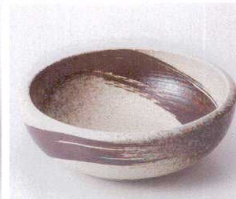
ハ053-31 志野サビ刷毛括り手4.0鉢 φ12.8×4.8cm 360円