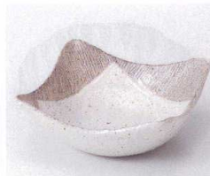
ネ053-30 白唐津4.8角鉢 12.8×12.8×5.1cm 700円