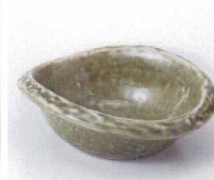
モ053-20 灰釉帽子型4.0小鉢 14×16×5.5cm 640円