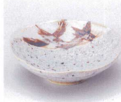
口053-03 石垣志野平小鉢 φ13.8×4.2cm 760円