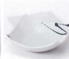
ツ053-10 白釉黒一珍四方形鉢(小) 13×13×4.5cm 730円