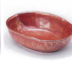
口053-04 紅結晶楕円浅鉢 15.5×11×4.3cm 720円