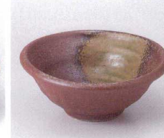
キ053-05 備前風吹織部中鉢 13.6×13×5.3cm 750円