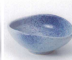
カ053-21 吹墨たまご型4.0小鉢 14.2×11.5×5.8cm 630円