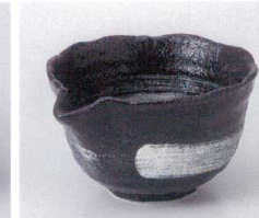
テ053-34 黒水晶刷毛4.0片口小鉢 14×11.7×7cm 650円