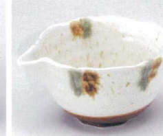
ミ053-22 白唐津二色流し片口小井 13.8×11.8×7cm 630円