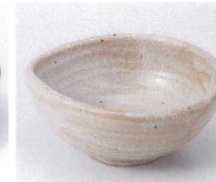
ネ053-28 唐津楕円小鉢 13.5×12×5.2cm 600円