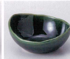
ハ053-32 織部変型中鉢 13.2×12.3×5.7cm 630円