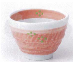
ハ053-29 ピンク小花小鉢 φ9.3×6.4cm 600円