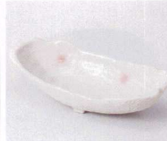
ア053-14 ピンク吹き長小鉢 20×9.2×5cm 700円