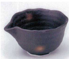
ミ053-23 美濃備前片口4.0小鉢 13.8×11.8×7cm 630円