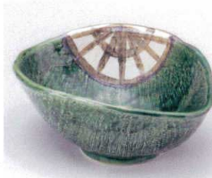
ミ053-02 織部口マン変型小鉢 15×11.8×6cm 750円