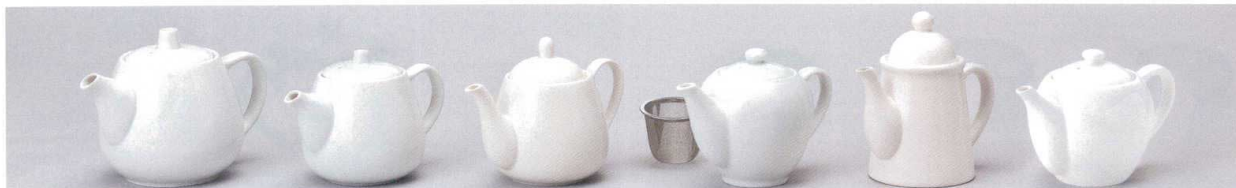
ウ608-01 大ポット(白)5人用 19×8.8×3.3cm(850cc) 3,100円 ウ608-02 小ポット(白)3人用 17×7.7×10.8cm(500cc) 2,500円 ウ608-03 NBポット3人用 17×7.7×10.8cm(500cc) 2,600円 ア608-04 白磁ポット 16.7×10×11.6cm(430cc) 2,000円 ケ608-05 176ストーンポット φ9.2×14cm(410cc) 1,700円 ホ608-06 NBアミ付ポット(おとし金網付) φ11×11.5cm(550cc)(中国) 1,600円