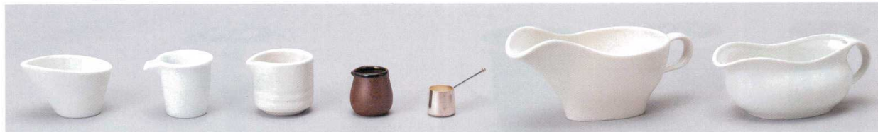
ヤ608-27 白8cmスライドボール 8×6.3×5cm 300円 カ608-28 白磁プチピッチャー 6.2×4.8×5cm(45cc) 570円 カ608-29 白マットフレッシュ 5.8×5.1×5cm(60cc) 600円 タ608-30 伊賀ピッチャー 3.6×3.8cm(25cc) 280円 カ608-31 銀メッキピッチャー 7.2×2.2×H2.5cm 330円 ウ608-32 NBクレピー 19×8.8×8cm 1,430円 ウ608-33 クツカレー 15.3×8×6cm(280cc) 1,030円