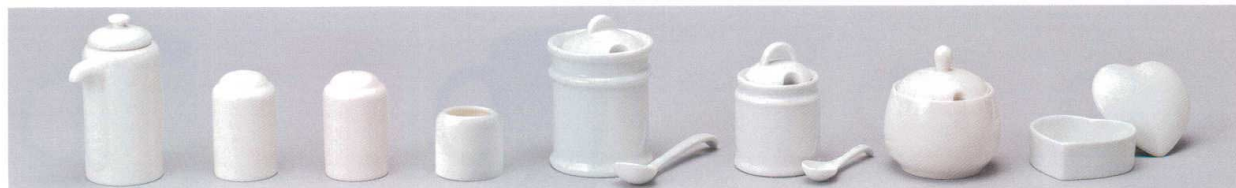
ウ608-40 ボンソース入 φ6×12.3cm(290cc) 1,050円 ウ608-41 ボン汁次 φ5.7×9.8cm(145cc) 1,050円 ウ608-42 ボン胡椒入(三ツ穴) φ4.8×7.8cm 640円 ウ608-43 ボン塩入(一ツ穴) φ4.6×7.8cm 640円 ウ608-44 ボン楊枝入 φ5×4.6cm 520円 ケ608-45 165スプーン付ジャムジャー(L) φ7.7×11.1cm 1,550円 ケ608-46 166スプーン付ジャムジャー(S) φ6×9.2cm 1,450円 テ608-47 A・N・Wシュガーポット 白磁花レンゲ φ6.3×9.2cm(輸入品) 630円 ウ608-48 NBシュガー φ8×9.5cm(200cc) 1,370円 ケ608-49 50ハート型フタモノ(L) 8×4.3cm 650円 ケ608-50 53ハート型フタモノ(M) 5.8×4cm 450円