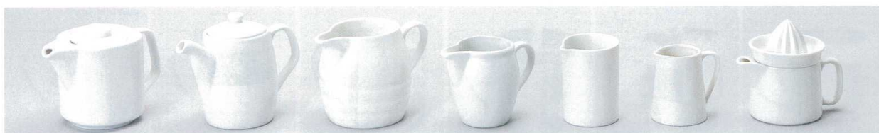
テ608-07 A・N・W角ポット 460cc(輸入品) 1,260円 テ608-08 A・N・Wコーヒーポット 400cc(輸入品) 1,130円 ヤ608-09 タル型ジョグ大 φ10×15×10.5cm(650) 2,000円 ヤ608-10 タル型ジョグ小 φ7×11×7cm(200) 1,080円 テ608-11 A・N・Wクリーム-A型(大) 260cc(輸入品) 520円 テ608-12 A・N・Wクリーム-A型(小) 195cc(輸入品) 410円 テ608-13 A・N・Wクリーム-B型 170cc(輸入品) 460円 ウ608-14 白ピッチャー(5人用) φ4.9×8cm(140cc) 540円 ケ608-15 ポット付レモン絞り φ8×11.5cm(260cc) 1,100円