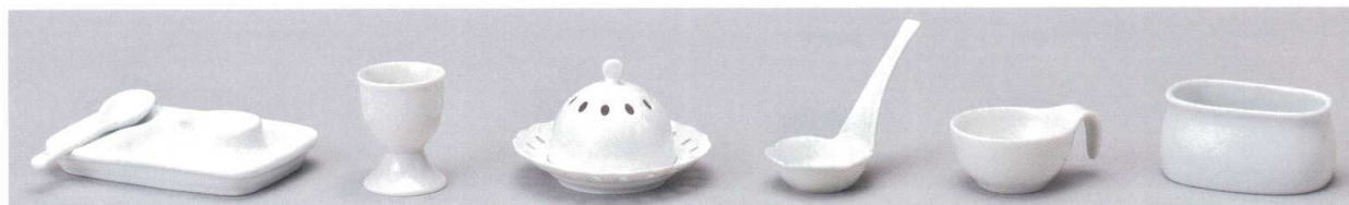
テ608-34 A・N・Wエッグスタンド(スプーン付) 14×9.5×3cm(輸入品) 750円 ケ608-35 354エッグスタンド φ4.8×6.4cm 300円 テ608-36 A・N・Wふた物小皿 φ11×6.6cm(輸入品) 920円 ウ608-37 白磁花レンゲ 6×2cm 600円 ヤ608-38 白手付プチボール 9×6.7×3.5cm 270円 テ608-39 A・N・Wスティックシュガー入れ 5.9×9.5×4.8cm(輸入品) 350円