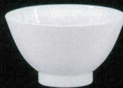
カ631-15 大茶碗 φ12.5×7.6cm 900円