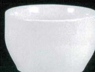
カ631-11 かゆ丼(大) φ14.8×9cm 2,300円