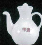
カ631-36 カスター辣油 125cc φ11.4×5.8cm 1,500円