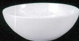
カ631-08 6.5ボール φ20.1×7.2cm 1,450円