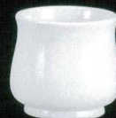
カ631-07 ガラ入 φ9.5×9.6cm 1,100円