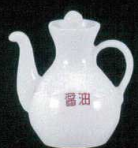
カ631-34 カスター醤油 125cc φ11.3×5.9cm 1,500円