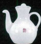
カ631-35 カスター酢 125cc φ11.4×5.8cm 1,500円