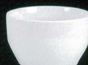
カ631-12 かゆ丼(小) φ13×7.9cm 1,680円