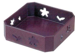
I693-09 A 隅切透かし盛器 溜 18.2×18.2×5.8cm 2,250円