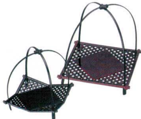
I693-10 A (小) いさざかご 黒 16×16×17cm 700円