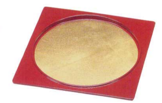
I693-31 M 円月皿 金箔洩朱 22.6×22.6×1.8cm 3,650円