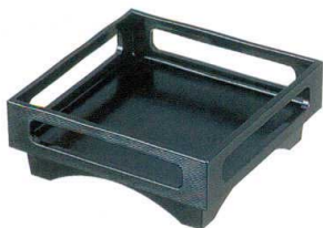
I693-28 A 5.5寸日野盛器 黒 16.8×16.8×6.5cm 2,000円