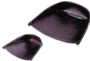
Mみ溜 I693-12 (小) 1,050円 13.2×11×3.8cm I693-13 (大) 1,850円 20.5×17.5×5.7cm