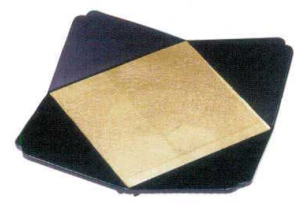
I693-30 A 木瓜天皿 黒に金箔 22.5×22.5×2.8cm 3,250円