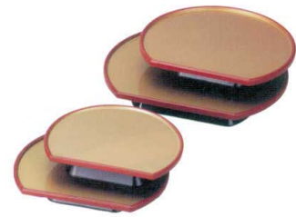
A半月高台皿 金洩朱 I693-15 5.5寸 1,700円 16.5×13.7×3.8cm I693-16 6寸 1,950円 18.4×15.8×3.8cm I693-17 7寸 2,100円 20.2×17.8×4cm I693-18 8寸 2,500円 24.2×21.2×4.5cm