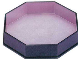
I693-08 A 八角盛器 ピンク雲流洩黒 21.8×20.2×4.6cm 2,600円