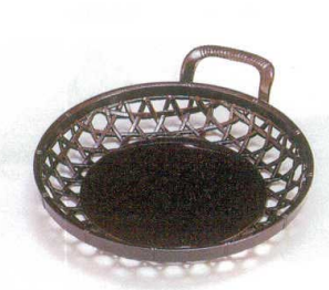
A片手かご 茶パール I693-19 5寸 570円 φ16.3×4cm I693-20 6寸 670円 φ19.5×4.4cm