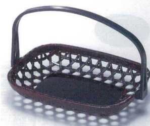
A長手手提かご 溜 (折畳式) I693-24 5.5寸 750円 16.8×12.2×11cm I693-25 7寸 1,000円 20.6×15×14.3cm I693-26 9寸 1,500円 26.5×16.8×15cm