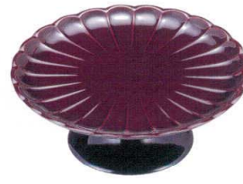
I693-14 M 5.5寸菊高台皿 溜 φ16.6×6.2cm 2,250円