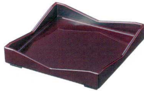
I693-07 A 6寸角太閤皿 溜底黒塗 S.S.溜 18.2×18.2×3.8cm 2,200円