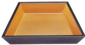
I693-06 A 富士型鉢 黒内金雅 20×13.3×3.7cm 2,900円