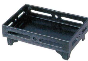
I693-29 A 7.5寸長手足付透かし盛器 黒 22.4×15×7.4cm 2,550円