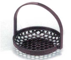
A竹かご マロン (折畳式) I693-21 5寸 700円 φ14.8×14.4cm I693-22 6寸 850円 φ17.9×17cm I693-23 7寸 1,000円 φ21×19.5cm