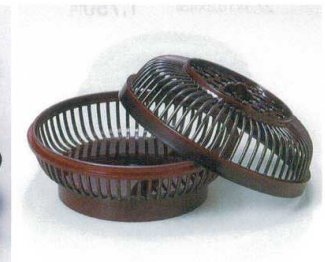
I693-27 A 銀河かご 溜 φ16.7×9cm 2,700円