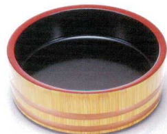
I694-34 [A]D.X7.5寸盛込桶 白木帯金内黒塗 φ22.8×7.9cm 3,200円