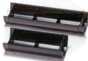
I694-08 [A]竹取盛器 スス竹三点盛り 29.8×10.1×4.8cm 3,000円