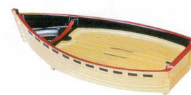
[A]尺1寸タレ付舟白木(スノコ別売) I694-38 舟 3,100円 33×17×7cm I694-39 スノコ 1,100円