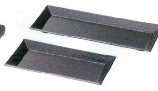
I694-18 [A]華やか三点鉢 新黒石目 28.7×10.9×2cm 800円