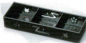
I694-10 [A]9寸固定三点珍珠入れ 黒 27.8×9.1×4.8cm 1,700円