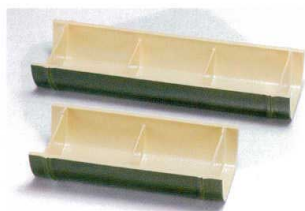
I694-06 [A]竹取盛器 若竹三点盛り 29.8×10.1×4.8cm 3,000円