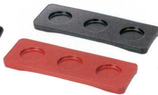
I694-16 [A]三点珍珠台 新黒石目 26.1×9.1×1.6cm 1,050円