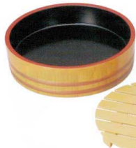
I694-36 [A]D.X尺0寸盛込桶 白木帯金内黒塗 φ30×8.5cm 4,900円