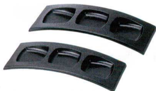
I694-14 [A]3連珍珠 新黒石目(小) 24.5×9.3×3.5cm 1,550円