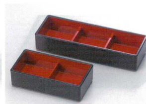
I694-12 [A](小)三点珍珠入れ 黒内朱 19.3×6.8×3.7cm 950円