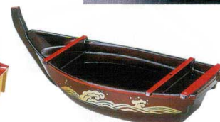
I694-40 [A]尺5寸将軍舟 溜波 45.5×18.6×15.5cm 3,700円