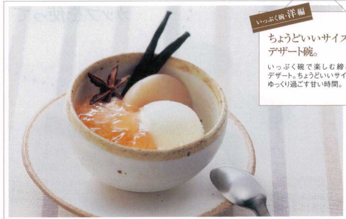
いっぷく碗・洋編

ちょうどいいサイズの デザート碗。 いっぷく碗で楽しむ絡めのデザート。ちょうどいいサイズでゆっくり過ごす甘い時間。