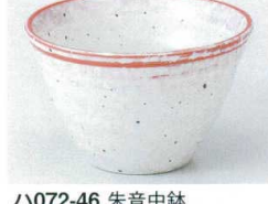
ハ072-46 朱音中鉢 φ11.1×7.3cm 720円 ハ072-47 朱音小鉢 φ9.3×6.8cm 660円