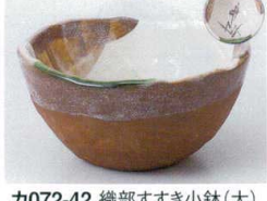
カ072-42 織部すずき小鉢(大) φ11.3×5.7cm 720円 カ072-43 織部すずき小鉢(小) 9.8×4.8cm 630円