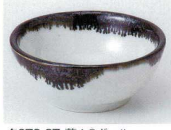
タ072-27 藍4.0ポール 11.6×4.5cm 750円 タ072-28 藍3.3ポール 9×3.8cm 520円 タ072-29 藍千代口 8.3×3.5cm 410円