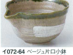
イ072-64 ページュ片口小鉢 13.8×11.7×7.2cm 660円 イ072-65 ページュ片口小付 9.5×8.3×6cm 400円