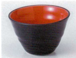
ハ072-03 朱天目小鉢 φ11×7.3cm 880円 ハ072-04 朱天目デザート碗 φ9.3×6.8cm 770円