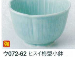
ウ072-62 ヒスイ梅型小鉢 φ10.8×6.8cm 650円 ウ072-63 ヒスイ梅型小付 φ8.6×5.5cm 520円