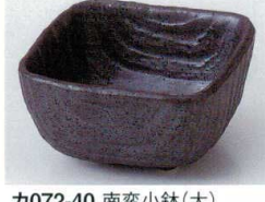
カ072-40 南蛮小鉢(大) 11.5×11.5×6cm 720円 カ072-41 南蛮小鉢(中) 9.5×9.5×4.8cm 600円