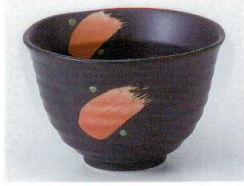
テ072-14 黒マツト赤カスリ3.6小鉢 φ10.8×7cm 800円 テ072-15 黒マツト赤カスリ3.3小鉢 φ9.8×6.5cm 680円