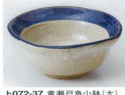
ト072-37 黄瀬戸角小鉢(大) φ12×5.5cm 720円 ト072-38 黄瀬戸角小鉢(中) φ10.5×4.5cm 570円 ト072-39 黄瀬戸角小鉢(小) φ9×4cm 420円