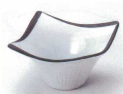
□072-05 あかり花型小鉢(大) 10.8×10.8×6cm 850円 □072-06 あかり花型小鉢(小) 8.2×8.2×5.5cm 560円