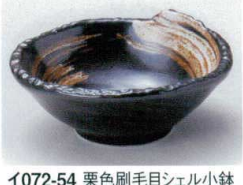
イ072-54 栗色刷毛目シェル小鉢 φ12.5×5cm 680円 イ072-55 栗色刷毛目小付 φ10×4.3cm 500円