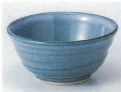
□072-01 よもぎ4.0小鉢 φ12×5.8cm 880円 □072-02 よもぎ3.5小鉢 φ10.8×5.5cm 760円

別身鉢 千代口 向付 中鉢 高台小鉢 小鉢 組小鉢 小付 蓋付珍味 珍味 セ小珍味 松花堂 蓋向 円黒子碗 むし碗 ミニむし碗 天皿 とんすい