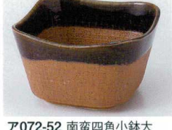
ア072-52 南蛮四角小鉢大 9.5×9.6×6cm 680円 ア072-53 南蛮四角小鉢小 8.3×8.3×5.2cm 600円