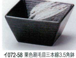
イ072-58 栗色刷毛目三本線3.5角鉢 10.7×10.7×5.8cm 680円 イ072-59 栗色刷毛目三本線小角鉢 8.2×8.2×5cm 460円