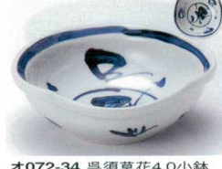
オ072-34 呉須草花4.0小鉢 12×4.5cm 730円 オ072-35 呉須草花3.6小鉢 10.1×3.8cm 690円 オ072-36 呉須草花変形千代久 8.3×3.2cm 650円