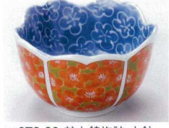
マ072-30 献上錦梅詰 小鉢 11×6cm 750円 マ072-31 献上錦(梅詰) 小付 9.5×5.5cm 520円