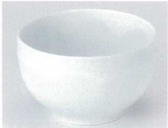
カ072-07 青白磁4.0井 φ12×7.8cm 830円 カ072-08 青白磁3.3井 φ9.8×6.4cm 550円