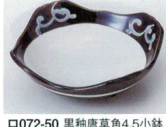
□072-50 黒釉唐草角4.5小鉢 12.2×12.1×4.1cm 690円 □072-51 黒釉唐草角3.3小鉢 9.6×9.4×4.1cm 560円