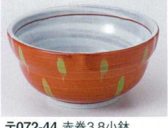
テ072-44 赤巻3.8小鉢 φ11.7×5.6cm 720円 テ072-45 赤巻3.5小鉢 φ10.6×5cm 600円