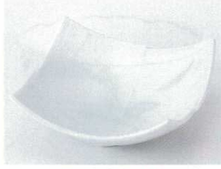
イ072-16 青地市松彫4.5鉢 14×14×5.2cm 800円 イ072-17 青地市松彫3.5鉢 11×11×6cm 720円