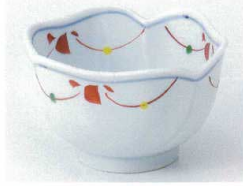
□072-11 赤絵花ツナギ4.0小鉢 11.5×7.3cm 830円 □072-12 赤絵花ツナギ3.5小鉢 10.4×6cm 690円 □072-13 赤絵花ツナギ3.0小鉢 9×5.5cm 600円