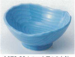
オ072-32 トルコ木目4.0小鉢 11.5×12.5×5.5cm 750円 オ072-33 トルコ木目3.3小鉢 9×8.7×5cm 490円