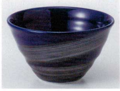
ア072-18 銀彩たまり碗 φ13.5×7.6cm 780円 ト072-19 銀刷毛ブルーリップル碗(小) φ11.5×7.2cm 600円 ハ072-20 銀彩ブルーリップル碗(ミニ) φ9.3×6.8cm 500円