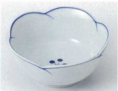
□072-09 染付梅ライン4.0小鉢 φ12.5×5.8cm 800円 □072-10 染付梅ライン3.5小鉢 φ10.5×5.3cm 630円