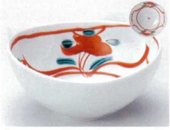
ヤ072-21 手描赤絵花楕円4.0鉢 13.3×12.9×6cm 780円 ヤ072-22 手描赤絵花楕円3.5鉢 10.8×10.5×5cm 700円