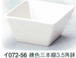
イ072-56 練色三本線3.5角鉢 10.7×10.7×5.8cm 680円 イ072-57 練色三本線小角鉢 8.2×8.2×5cm 460円