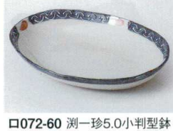
□072-60 測一珍5.0小判型鉢 15.2×11.1×3.8cm 670円 □072-61 測一珍3.5小判型鉢 10.8×8×3.1cm 350円