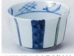
ア072-25 四方十草小鉢(大) φ11×6.3cm 750円 ア072-26 四方十草小鉢(小) φ10×5.5cm 680円