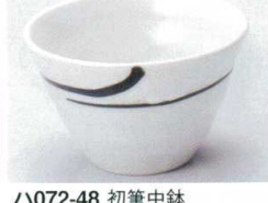
ハ072-48 初筆中鉢 φ11×7.3cm 700円 ハ072-49 初筆小鉢 φ9.3×6.8cm 600円