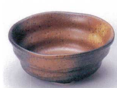
Ta075-45 黒備前3.6鉢 φ11.6×4.9cm 360円 Ne075-46 黒備前角浜3.0鉢 φ10×4.2cm 300円