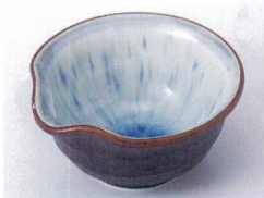
A075-01 乳白流片口3.6小鉢 10.6×10.3×5.5cm 450円 A075-02 乳白流片口珍味 9.2×8.8×4.6cm 380円