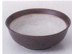
Ho075-59 櫛目紋4.0小鉢 φ13×4.5cm 320円 Ho075-60 櫛目紋3.5浅鉢 φ11×3.2cm 240円