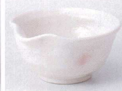
I075-18 御本手片口3.5小鉢 10.7×5.3cm 400円 I075-19 御本手片口珍味 9.3×4.5cm 350円