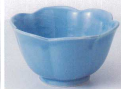
Ka075-38 ブルー花型小鉢(大) φ10.6×6.1cm 370円 Ka075-39 ブルー花型小鉢(小) φ9.1×5.5cm 290円