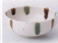
M075-07 二色十草丸4.0小鉢 11.7×5.4cm 420円 M075-08 二色十草丸3.5小鉢 9.8×4.8cm 350円