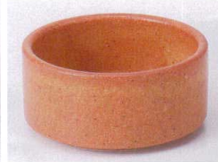
Ka075-27 赤志野スタック鉢大 φ8.5×4.0cm 380円 Ka075-28 赤志野スタック鉢小 φ7.8×3.1cm 360円