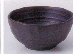
Ki075-63 いぶし黒3.5小鉢 10.7×5.2cm 280円 Ki075-64 いぶし黒3.0小鉢 9.5×4.5cm 240円