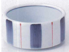
T075-12 赤一珍つみつき小付大 φ8.5×4cm 400円 T075-13 赤一珍つみつき小付小 φ7.7×3cm 360円