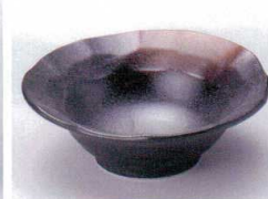
Ta075-40 黒備前金茶吹石垣小鉢 12×12×4.1cm 360円 Ta075-41 黒備前金茶吹石垣小付 9.8×9.7×3.5cm 320円