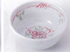
To075-20 赤絵文3.8梅形小鉢 φ11.7×6.2cm 400円 To075-21 赤絵文3.5梅形小鉢 φ10.5×5.6cm 350円 To075-22 赤絵文3.0小鉢 φ9.3×4.3cm 280円