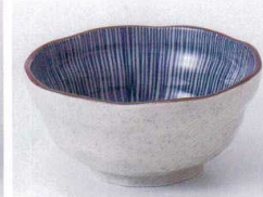
Ki075-52 測錆十草3.5小鉢 10.7×5.3cm 350円 Ki075-53 測錆十草3.0小鉢 9.3×4.3cm 300円