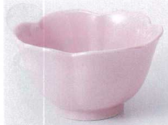
Ka075-34 ピンク花型小鉢(大) φ10.6×6.1cm 370円 Ka075-35 ピンク花型小鉢(小) φ9.1×5.5cm 290円