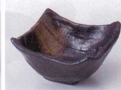
I075-29 黒釉四角小鉢(中) 10×5.7cm 380円 I075-30 黒釉四角小鉢(小) 8.5×5cm 320円