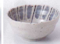
I075-42 唐津十草3.8小鉢 φ12×5.7cm 370円 I075-43 唐津十草3.5小鉢 φ10.8×5.5cm 300円 I075-44 唐津十草3.0小鉢 φ9.5×4.5cm 250円