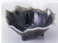
Ta075-14 灰釉流葉形小鉢 12.5×9.5×5.3cm 400円 Ta075-15 灰釉流葉形珍味 10×7.8×4.3cm 33円