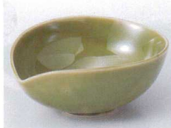
H075-03 花びら(織部)貫入小鉢 11.8×10×4.7cm 420円 H075-04 花びら(織部)貫入豆鉢 9.5×8.3×4cm 380円