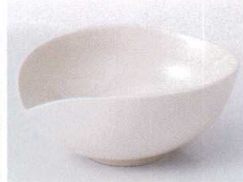
H075-05 花びら(白)貫入小鉢 11.8×10×4.7cm 420円 H075-06 花びら(白)貫入豆鉢 9.5×8.3×4cm 380円