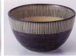
I075-09 唐津十草4.0ボール φ12.4×7.3cm 420円 I075-10 唐津十草3.5ボール φ11×6.2cm 380円 I075-11 唐津十草3.0ボール φ9.5×5cm 280円