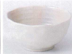
Ya075-61 窯変唐津3.5小鉢 φ10.9×5.4cm 295円 Ya075-62 窯変唐津3.0小鉢 φ9.3×4.6cm 250円