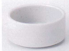
Ka075-25 白唐津スタック鉢大 φ8.5×4.0cm 380円 Ka075-26 白唐津スタック鉢小 φ7.8×3.1cm 360円