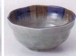
O075-31 二色刷毛目3.8小鉢 φ12×5.5cm 370円 O075-32 二色刷毛目3.5小鉢 φ10.5×5.3cm 300円 O075-33 二色刷毛目3.0小鉢 φ9.5×4.5cm 250円