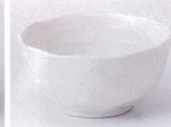
Ki075-65 灰マット3.5小鉢 φ10.7×5.2cm 280円 Ki075-66 灰マット3.0小鉢 φ9.5×4.5cm 240円