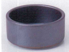
Ka075-23 黒鉄砂スタック鉢大 φ8.5×4.0cm 380円 Ka075-24 黒鉄砂スタック鉢小 φ7.8×3.1cm 360円