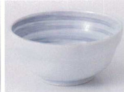
O075-49 粉引グレー刷毛目3.8小鉢 φ11.7×5.5cm 360円 O075-50 粉引グレー刷毛目3.5小鉢 φ10.6×5cm 290円 O075-51 粉引グレー刷毛目3.0小鉢 φ9×4.3cm 250円