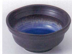
Ki075-47 深海(藍)小鉢(中) φ11×5cm 360円 Ki075-48 深海(藍)小鉢(小) φ9.4×4.1cm 340円