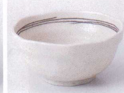
Ya075-54 茶ライン3.8小鉢 φ11.8×5.5cm 345円 Ya075-55 茶ライン3.5小鉢 φ10.7×5cm 280円 Ya075-56 茶ライン3.0小付 φ9.4×4.5cm 230円