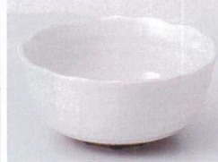
M075-16 粉引カヤ目4.0小鉢 11.7×5.4cm 400円 M075-17 粉引カヤ目3.5小鉢 9.8×4.8cm 320円