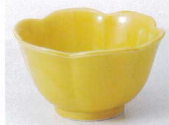
Ka075-36 イエロー花型小鉢(大) φ10.6×6.1cm 370円 Ka075-37 イエロー花型小鉢(小) φ9.1×5.5cm 290円