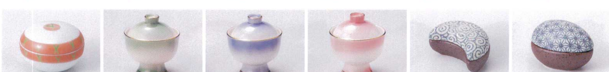
ウ083-38 錦カスリ蓋付珍味 4.9×3.4cm 600円 タ083-39 ヒワ吹蓋付珍味 φ6.8×7.5cm(中国) 570円 タ083-40 コバルト吹蓋付珍味 φ6.8×7.5cm(中国) 570円 タ083-41 ピンク吹蓋付珍味 φ6.8×7.5cm(中国) 570円 ア083-42 みかづき蓋付珍味 5.3×3.6×3cm 500円 ア083-43 たまご蓋付珍味 5.8×3.6×3.8cm 500円