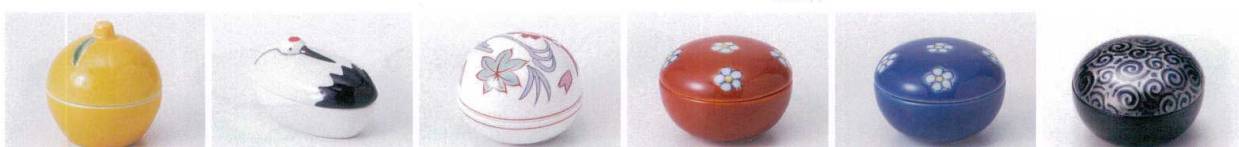
ネ083-26 ゆず珍味 φ5.5×5.4cm(輸入品) 900円 ネ083-27 鶴珍味 9×4.8×4.5cm 800円 ネ083-28 丸春秋蓋付珍味 5.2×3.8cm 880円 ウ083-29 散小花蓋付珍味(赤) 4.8×4.8×3.4cm 750円 ウ083-30 散小花蓋付珍味(紺) 4.8×4.8×3.4cm 750円 ウ083-31 ルリウス銀彩蓋付珍味 φ4.8×3.4cm 710円