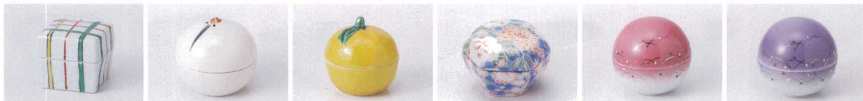
ウ083-13 色巻蓋付珍味 4.4×4.4×4cm 1,550円 オ083-14 ツル蓋付珍味(小) 5×4.5cm 1,490円 ミ083-15 ゆず小珍味 5×6cm 1,450円 タ083-16 友禪蓋付珍味 7.2×6.5×4.8cm 1,300円 ア083-17 ピンク武蔵野珍味 φ6.9×6.5cm 1,200円 ア083-18 パープル丸珍味 φ6.9×6.5cm 1,200円