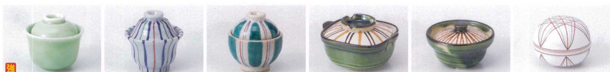
ア083-19 ヒワ蓋付珍味 φ7.7×6.5cm 1,200円 ウ083-20 錦十草蓋付反珍味 6.2φ×6.2cm 1,170円 ウ083-21 十草蓋付珍味 φ6.4×6.6cm 1,070円 □083-22 織部十草鍋型珍味(中) 8.7×7.5×4.8cm 1,000円 □083-23 織部十草鍋型珍味(小) 6.8×5.9×4cm 820円 □083-24 織部櫛目三つ足蓋付珍味 φ7.5×4.5cm 760円 ネ083-25 手まり珍味 φ6×4.5cm(輸入品) 940円