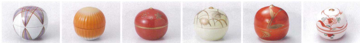
オ083-07 手まり珍味 6.3×6cm 1,600円 ウ083-08 オレンジ吹菊型蓋付珍味 6.6×6.6cm 1,500円 ウ083-09 金桜栗型珍味(小) 5×5.1cm 1,620円 ホ083-10 グリーン芦珍味(小) 5×5cm 1,600円 オ083-11 朱巻金笹蓋付珍味(小) 5×4.5cm 1,490円 ホ083-12 赤絵花珍味(小) φ5×5cm 1,600円