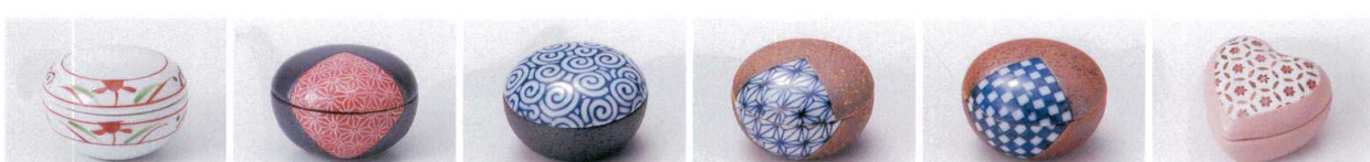
ウ083-32 錦小花蓋付珍味 4.9×3.4cm 700円 ト083-33 鉄結晶赤珍味 4.8×3.2cm 700円 ウ083-34 ウズ蓋付珍味 φ4.8×3.4cm 620円 ウ083-35 信楽刺子蓋付珍味 φ4.8×3.4cm 650円 ウ083-36 信楽市松蓋付珍味 φ4.8×3.4cm 650円 タ083-37 ピンクハート蓋物 4.7×4.3×3.2cm 520円