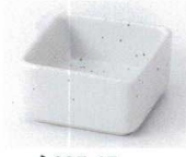
N085-45 白なしじ角珍味 6.3×6.3×3.3cm 260円