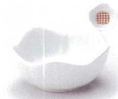
M085-09 華花型 珍味 7.5×3.5cm (有田焼) 500円