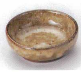
T085-17 アメイらいぎ豆千代口 φ6.8×2.5cm 480円