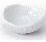
U085-27 青磁トチリ小付 7.6×7.2×3.2cm 400円