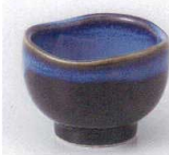
H085-43 天目均窯三ツ山珍味 6.3×4.2cm 340円