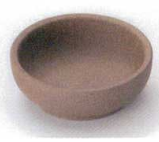
T085-18 焼き縮豆千代口 φ6.8×2.5cm 480円