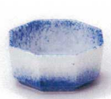
H085-32 吹墨八角スタック珍味 φ6.5×3cm 360円