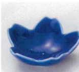
K085-35 ルリ桜型珍味 φ7.5×2.7cm 350円