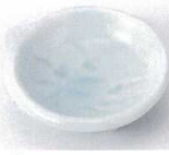
N085-20 青白磁三ツ足珍味 8×3cm 450円