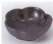
U085-36 黒伊賀梅型小付 8.3×3cm 320円