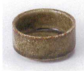
H085-44 灰釉丸千代口(スタック型) φ7×3.3cm 300円