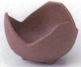
M085-03 南蛮三ツ山珍味 7.5×5cm 560円