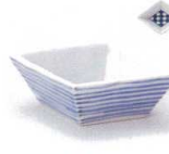
M085-21 濃市松 菱型珍味 9×6.5×3cm (有田焼) 500円