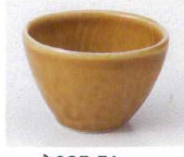
N085-51 黄瀬戸丸珍味 φ6.5×4.5cm 250円