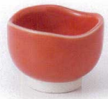
H085-42 朱色三ツ山珍味 6.3×4.2cm 340円