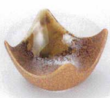
U085-39 信楽四ツ切珍味 6.7×3.8cm 300円