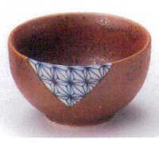
U085-25 信楽刺子小付 φ7.2×4.4cm 400円