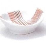
M085-26 帯絵 楕円小付 7.6×6.5×3cm 400円