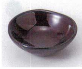
N085-16 漆ブラウンカヤマ盃 φ7.2×2.5cm 470円