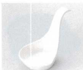
U085-30 白レンゲ型珍味 φ6.4×7.2×2.2cm 390円