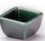
U085-33 織部角珍味 6×4cm 370円