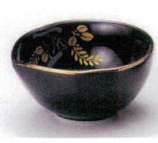
M085-24 天目絵 びさご型小付 7.2×6.8×3.5cm 400円