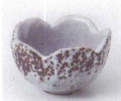
A085-01 伊賀志野珍味 φ6.8×4cm 550円