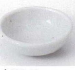
N085-48 白なしじタキ珍味 φ8.6×2.9cm 240円