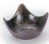
U085-38 黒伊賀四ツ切珍味 6.7×3.8cm 300円