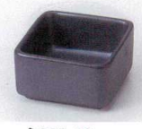
N085-46 黒結晶角珍味 6.3×6.3×3.3cm 260円