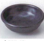
N085-49 黒結晶タキ珍味 φ8.6×2.9cm 240円