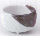
U085-40 志野塗分三ツ足珍味(大) 6.2×3.8cm 370円 U085-41 志野塗分三ツ足珍味(小) 4.8×3.8cm 330円