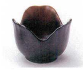
H085-22 備前吹三ツ山珍味 φ6.2×4.5cm 400円