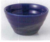
H085-23 銀彩ブルーリップル碗プチ φ7.4×4cm 400円