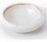
A085-47 粉引玉淵珍味 φ7.5×2.3cm 230円