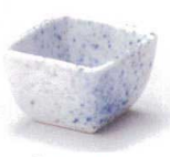
U085-19 吹墨角珍味 5.8×4cm 450円