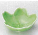
K085-34 ヒワ桜型珍味 φ7.5×2.7cm 350円