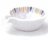
M085-29 瀬十草 片口小付 8.5×7.2×2.9cm 400円