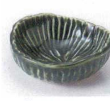
U085-28 織部トチリ小付 7.6×7.2×3.2cm 400円