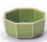
H085-31 ヒワ八角スタック珍味 φ6.5×3cm 360円