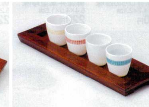
ア088-70 白磁透光タル珍味イエロー φ5.5×5.5cm 950円 ア088-71 白磁透光タル珍味ピンク φ5.5×5.5cm 950円 ア088-72 白磁透光タル珍味白 φ5.5×5.5cm 700円 ア088-73 白磁透光タル珍味ブルー φ5.5×5.5cm 950円 ウ088-74 桜色トレイ(大) 約34.2×10.7×H2cm 4,450円