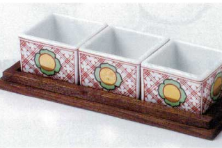
ウ088-35 金丸紋珍味揃 3,050円 ウ088-36 金丸紋マス型珍味 4.9×4.9×3.4cm 840円 ウ088-37 焼杉台 16.7×6.8×1.3cm 820円