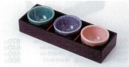
ホ088-19 トルコそぎ珍味 6.7×4.2cm 680円 ホ088-20 藍ブルーそぎ珍味 6.7×4.2cm 680円 ホ088-21 オレンジそぎ珍味 6.7×4.2cm 680円 ホ088-22 黒塗珍味箱 23×9×4.5cm 1,300円