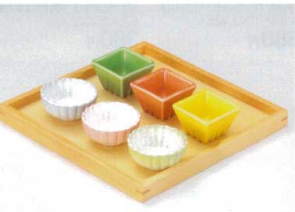
ア088-52 イエー筋彫角珍味 5.5×5.5×3.5cm 320円 ア088-53 ヒワ筋彫角珍味 5.5×5.5×3.5cm 320円 ア088-54 ピンク筋彫角珍味 5.5×5.5×3.5cm 320円 ア088-55 パール花型珍味パール(強化) φ6.5×3cm 1,000円 ア088-56 パール花型珍味ピンク(強化) φ6.5×3cm 1,000円 ア088-57 パール花型珍味ヒワ(強化) φ6.5×3cm 1,000円 ア088-58 白木9ピース皿専用トレイ 23.3×23.3×H2cm 2,650円