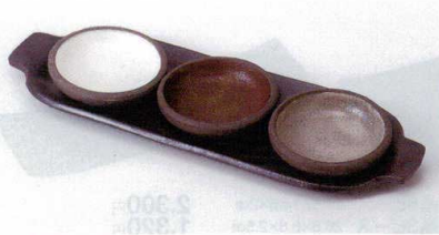
カ088-01 ミツ組小皿(白) 7.6×2cm 650円 カ088-02 ミツ組小皿(赤) 7.6×2cm 650円 カ088-03 ミツ組小皿(グレー) 7.6×2cm 650円 カ088-04 ミツ組豆鉢トレー 28.3×9cm 1,800円

割身鉢 千代口 向付 中鉢 高台小鉢 小鉢 組小鉢 小付 置付珍味 珍味 セット珍味 松花堂 蓋向 円菓子碗 むし網 ミニむし網 天皿・とんすい とんすい