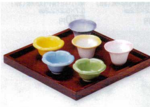
ウ088-59 青銅型珍味(強化) φ7×3.5cm 250円 ウ088-60 トルコ銅型珍味(強化) φ7×3.5cm 250円 ウ088-61 ヒワ銅型珍味(強化) φ7×3.5cm 250円 ア088-62 銅器珍味(ピンク) φ6.5×4.5cm(輸入品) 410円 ア088-63 銅器珍味(黄) φ6.5×4.5cm(輸入品) 410円 ア088-64 銅器珍味(ルリ) φ6.5×4.5cm(輸入品) 410円 ウ088-65 桜色9ピース皿専用トレイ 23.3×23.3×H2cm(約)21.7×21.7×H1.2cm 3,550円