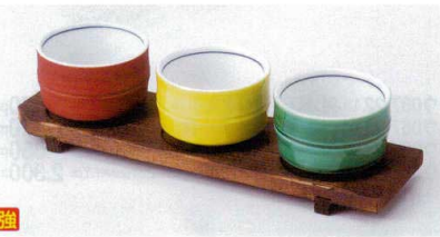
カ088-27 竹型珍味赤 6×3.8cm 1,150円 カ088-28 竹型珍味グリーン 6×3.8cm 1,150円 カ088-29 竹型珍味黄 6×3.8cm 1,150円 カ088-30 焼杉台 21×6×1.5cm 1,200円