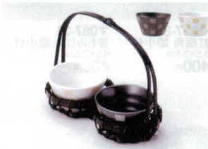
ネ088-42 白四角模様丸珍味 φ7.3×4.1cm 220円 ネ088-43 黒四角模様丸珍味 φ7.3×4.1cm 220円 ウ088-44 染竹ミニ籠(2連) 16.5×H13cm 1,850円