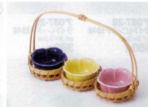
ウ088-45 ルリ梅型珍味 6.2×4.4cm 230円 ウ088-46 黄梅型珍味 6.2×4.4cm 230円 ウ088-47 赤梅型珍味 6.2×4.4cm 230円 ウ088-48 白竹ミニ籠(3連) 24×8×H13cm 2,350円