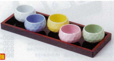
口088-13 ピンク玉彫珍味 φ4.8×3cm 450円 口088-14 グリーン玉彫珍味 φ4.8×3cm 450円 口088-15 ブルー玉彫珍味 φ4.8×3cm 450円 口088-16 黄玉彫珍味 φ4.8×3cm 450円 口088-17 青磁玉彫珍味 φ4.8×3cm 450円 口088-18 黒塗盆 22.2×8.2×1.3cm 1,150円