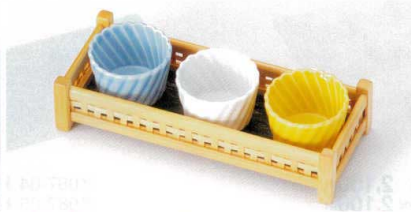
ウ088-05 トルコネジリ菊型珍味 5.8×4.1cm 320円 ウ088-06 青白ネジリ菊型珍味 5.8×4.1cm 320円 ウ088-07 黄ネジリ菊型珍味 5.8×4.1cm 320円 ウ088-08 白竹格子角長舞台 21×8.5×H4.5cm 4,100円