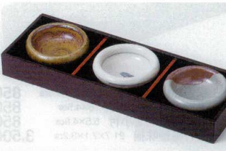
ウ088-23 灰釉丸珍味 7×2.8cm 400円 ウ088-24 白マット点丸珍味 7×2.8cm 400円 ウ088-25 南蛮塗分丸珍味 7×2.8cm 400円 ウ088-26 珍味台 24.5×8.4×2.7cm 880円