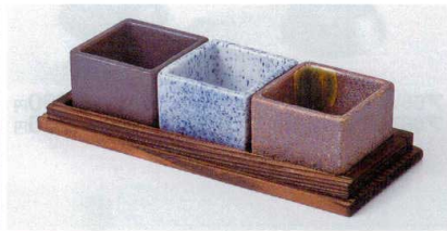
ウ088-31 黒伊賀升型珍味 4.8×4.8×3.4cm 380円 ウ088-32 吹墨升型珍味 4.8×4.8×3.4cm 410円 ウ088-33 信楽升型珍味 4.8×4.8×3.4cm 380円 ウ088-34 焼杉珍味台 16.7×6.8×1.3cm 820円