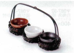
キ088-38 鉄赤珍味 φ6.3×3.7cm 270円 キ088-39 白梨地珍味 φ6.3×3.7cm 270円 キ088-40 黒マット珍味 φ6.3×3.7cm 270円 ウ088-41 染竹ミニ籠(3連) 24×8×H13cm 2,500円