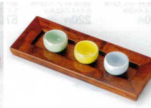
ネ088-66 青磁ミニ太鼓ボール φ4.3×3.3cm(輸入品) 350円 ネ088-67 黄ミニ太鼓ボール φ4.3×3.3cm(輸入品) 350円 ネ088-68 ヒワミニ太鼓ボール φ4.3×3.3cm(輸入品) 350円 ウ088-69 桜色トレイ(小) 約27.3×10.8×H2cm 4,150円