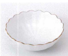
ソ095-27 測金花型小鉢(白) φ11.2×3.7cm 840円