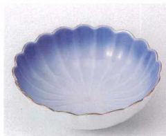
ソ095-24 測金花型小鉢(コバルト) φ11.2×3.7cm 860円