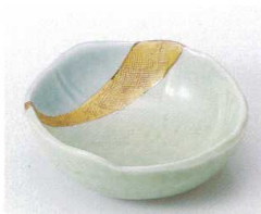
ミ095-23 青磁ヒワ金流し平鉢 11.2×10.8×3.5cm 950円