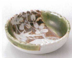
ミ095-19 織部山草花丸鉢 φ11.2×3cm 1,100円