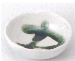
ソ095-28 白マット織部流し平鉢 φ11.5×10.9×4cm 850円