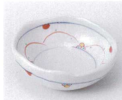
ミ095-20 花かご平鉢 11.3×10.6×3.6cm 1,050円