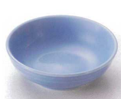
ウ095-07 ブルー丸鉢(大) φ11×3.5cm 730円 ウ095-08 ブルー丸鉢(小) φ9.6×3cm 490円