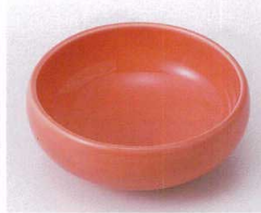
ソ095-03 オレンジ釉鉄鉢型小鉢 φ10.8×4.5cm 760円