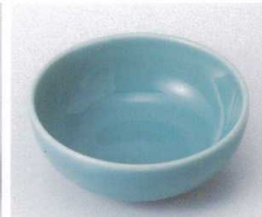
ネ095-16 青磁3.3ボール φ10.7×4.2cm 330円