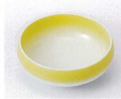
ソ095-04 イエロー鉄鉢型小鉢 φ10.8×4.4cm 720円