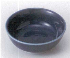
ミ095-06 青釉丸鉢 φ11.3×4.4cm 750円