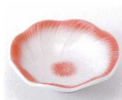
ア095-30 フヨウ平小鉢 φ11.2×3.7cm 460円