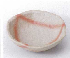
ア095-26 火だすき六角小鉢 11.5×3.2cm 850円