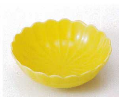
ソ095-29 黄花型小鉢 φ11.2×3.7cm 760円