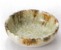
カ095-22 灰釉流丸鉢 11×3.2cm 950円