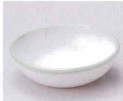
ミ095-09 白磁グリーン吹丸鉢 φ11.4×3.3cm 660円