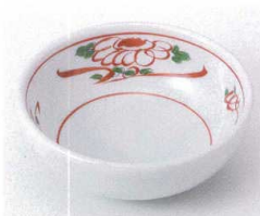
オ095-12 青磁赤絵3.5ボール φ11.5×4cm 460円