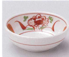
ア095-10 手描き赤絵万暦11.5cm鉢 φ11.5×4cm 680円