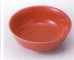
ミ095-05 赤釉丸鉢 φ11.3×4.4cm 750円