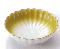
ウ095-25 ヒワ吹菊型平鉢 11.4×3.5cm 880円