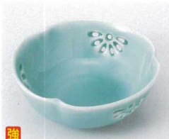
ソ095-17 深海青磁三ツ押小鉢 φ10.5×4cm 1,550円