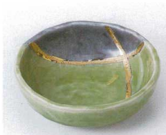
ア095-18 若草金彩3.8鉢 φ11.5×3.7cm 1,150円