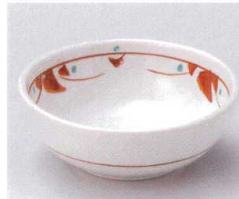
ア095-15 手描き赤絵花紋小鉢 φ11.5×4cm 550円