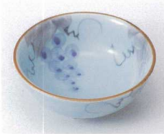
ミ095-01 手書きぶどう丸鉢 φ11.2×4.2cm 780円