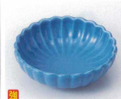
口095-21 トルコ菊型鉢 φ11×3.5cm 1,020円