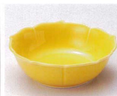
ホ095-31 黄花形松花堂小鉢 φ10.7×3.5cm 600円