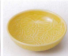
ホ095-11 黄色唐草彫丸鉢 φ11×3.2cm 660円