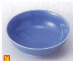
カ095-14 紫玉割 φ11.8×4cm 580円