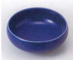
ソ095-02 トルコ釉鉄鉢型小鉢 φ10.8×4.5cm 760円