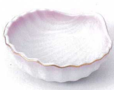
ツ097-08 ピンク吹貝型小鉢 11.8×11.4×4cm 830円