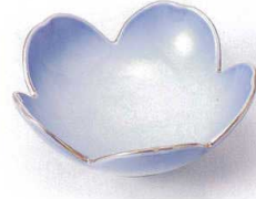
ツ097-05 測金コバルト桜型小鉢 φ11.4×4.4cm 880円