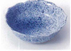
ウ097-21 吹墨桔梗型平鉢 10.5×3.5cm 660円