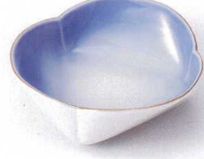
ツ097-04 コバルト小鉢 11.5×3.8cm 880円