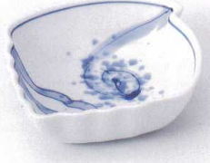
ツ097-02 巻貝型小鉢 11.4×11.4×3.8cm 900円