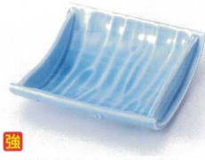
ウ097-24 トルコ舟型平鉢 10.8×3.3cm 590円