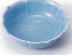
ウ097-23 トルコ桔梗型平鉢 10.5×3.5cm 620円