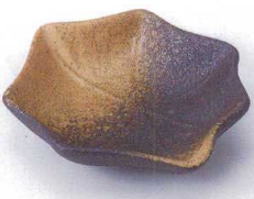
テ097-18 茶釉備前吹八手松花堂 13×10.8×3.3cm 750円