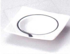
ホ097-25 ひと筆深角松花堂 11.2×11.2×2.8cm 580円