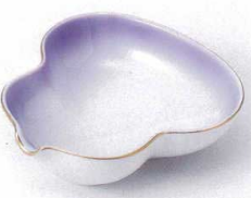
ツ097-07 マロン吹ひさご型小鉢 11.2×11.2×3.1cm 850円