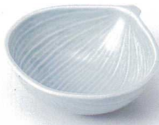
ト097-29 ブルーオニオン小鉢 11.2×11.2×3.8cm 520円