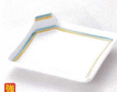
ウ097-10 錦測筋角皿 10.8×3.4cm 820円