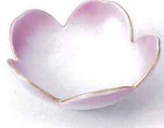
ツ097-03 測金ピンク桜型小鉢 11.5×4.5cm 880円