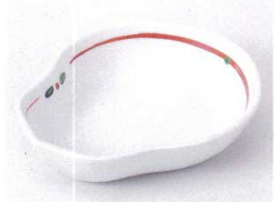
ト097-06 若芽ひさご鉢 12.4×11×2.8cm 850円