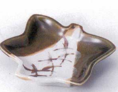
ミ097-12 織部芦楓皿 11.5×11.5×2.6cm 780円