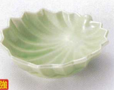
ウ097-27 ヒワカエデ型平鉢 11.4×11×3cm 560円