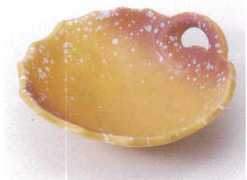
ミ097-01 マロン吹木の葉皿 12.5×11.8×3.8cm 900円