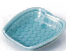
ト097-14 青磁ざる型小鉢 11×11×3.3cm 780円