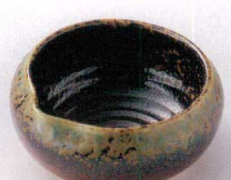
ア097-13 赤釉伊良保片口3.8鉢 φ10.5×4.6cm 780円