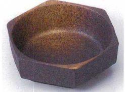
テ097-16 茶釉備前吹六角松花堂 11.2×10.2×3.6cm 750円