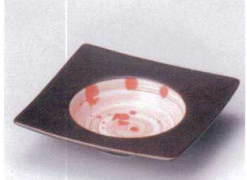
ハ097-11 紅染11cm角深皿 11.2×11.2×2.3cm 880円