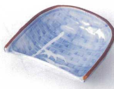
ア097-19 笹ざる型小鉢 10.5×10.5×3.7cm 700円