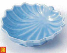
ウ097-28 トルコカエデ平鉢 11.2×11×3.2cm 550円