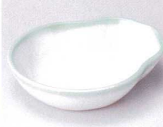
ミ097-20 白磁グリーン吹瓢鉢 12.6×10.8×2.8cm 660円