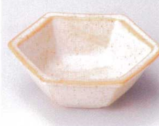
ウ097-30 志野六角鉢 10×3.6cm 490円