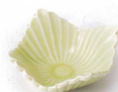
ツ097-15 ヒメ釉菊型小鉢 10.6×10.8×4.6cm 760円