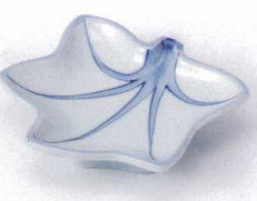
ネ097-17 楓型シベ皿 11.2×11.2cm 750円