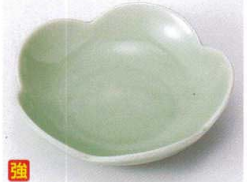
ウ097-26 グリーンサクラ型鉢 11×2.6cm 570円