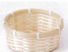
フ099-30 白竹七瀬 φ10×H5.5cm(ベトナム) 220円