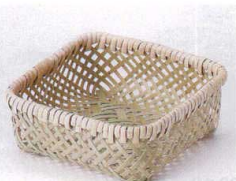
フ099-28 青竹珍味籠(角) 11×11×H4cm(中国) 430円