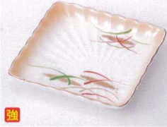
カ099-02 加茂川菊型角皿 11.2×11.2×2cm 1,500円