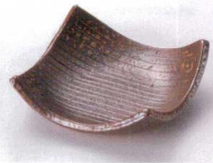
ミ099-03 手造り備前測上り皿 11.8×11.8×3.7cm 1,400円