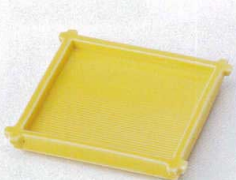
オ099-18 黄釉井桁皿 11.5×11.5×1.6cm 650円