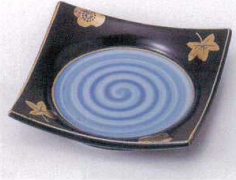
ミ099-04 黒釉春秋正角皿 11.5×11.5×2.3cm 1,450円