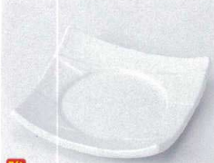
ウ099-16 白磁松花堂 11×2.5cm 830円