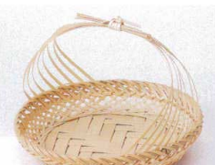
フ099-22 白竹かごめ結び籠 φ11×H8cm 1,350円