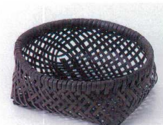
フ099-26 染竹珍味籠(丸) φ11×H4cm(中国) 500円