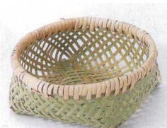
フ099-29 青竹珍味籠(丸) φ11×H4cm(中国) 430円