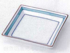
ソ099-15 測グリーン角皿 11×2.3cm 900円