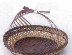
フ099-23 染竹かごめ結び籠 φ11×H8cm 1,350円