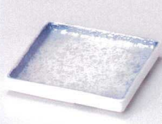
ホ099-12 ブルーパール松花堂角皿 10.3×10.3×1.8cm 980円