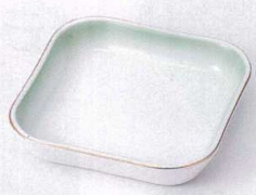
ソ099-14 ヒワ吹測金正角皿 11.2×2.3cm 880円