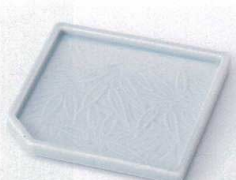
ト099-19 青磁笹角皿 11.6×11×1.2cm 480円