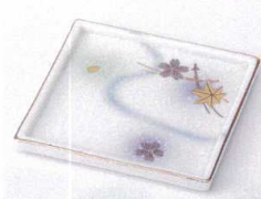
カ099-11 白吹竜田川角皿 11.2×11.2cm 1,050円