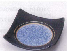
カ099-10 黒釉吹墨四方上り皿 11×11×3cm 1,050円