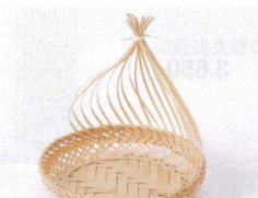
フ099-24 白竹かごめかまくら φ11×H12.5cm 1,350円