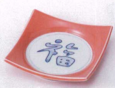
ソ099-13 柿釉見込福四方皿(中) 11.5×2.5cm 900円