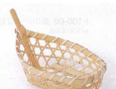
フ099-25 松花堂舟型(白) 13.5×8×H5.5cm(中国) 880円