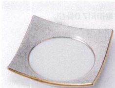
カ099-06 グリーン吹き角四方皿 11.4×11.4×2.5cm 1,300円