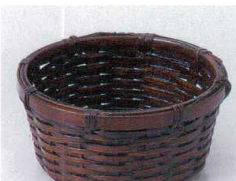
フ099-21 溜塗七瀬 φ10×H4cm(ベトナム) 1,700円