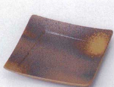
ホ099-17 備前吹き松花堂角皿 11.3×11.3×1.7cm 660円