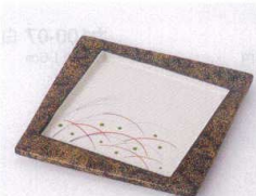
ミ099-07 秋草金タタキ正角皿 11.4×11.4×1.1cm 1,300円