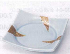
ミ099-08 青白金彩正角皿 11.5×11.5×2.3cm 1,200円