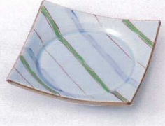
ミ099-05 流し十草四方皿 11.4×11.4×2.3cm 1,350円