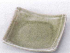
ネ099-20 灰釉10.cm角皿 10.5×10.5×2.0cm 390円