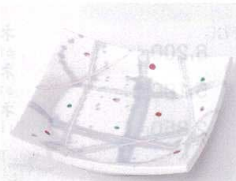
ト099-09 銀彩ちらし四方皿 11.2×11.2×2.5cm 1,100円