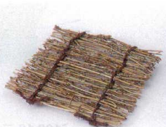
フ099-27 松花堂用筐ミス 11×11cm 500円