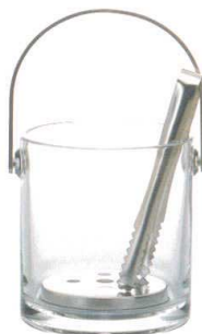
56776N 氷入 ¥1,800 18コ入 (1×18) φ122×H130・M135 ポリキャップ付吊手・目皿・トング (材質:ステンレス)日本製 49 06678 140689