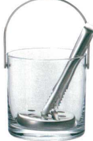
62878N トッカータ ¥6,000 12コ入 (1×12) φ130×H130・M140 ポリキャップ付吊手・目皿・トング (材質:ステンレス)日本製 49 06678 146049 ●