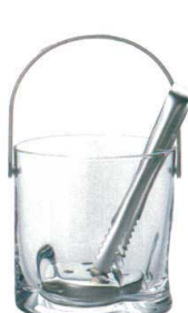
62868N ニューピッチ ¥5,400 12コ入 (1×12) φ121×H120・M125 ポリキャップ付吊手・目皿・トング (材質:ステンレス)日本製 49 06678 146018 ●