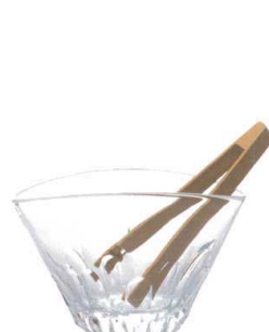
P-33602-JAN 本格焼酎道楽 えくぼ ¥2,100 16コ入 (1×16) W176×D129×H115 トング(材質:竹)中国製 49 06678 132325