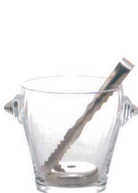
62596 ロマンディ ¥5,500 12コ入 (1×12) φ116×H120・M160 目皿・トング(材質:ステンレス)日本製 49 06678 764304 ●