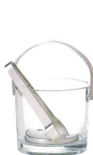
P-12601-JAN アイスペール ¥1,600 16コ入 (1×16) φ127×H108・M140 ポリキャップ付吊手・目皿・トング (材質:ステンレス)日本製 49 61373 029516