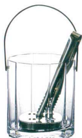
62582 ロージュ ¥5,500 12コ入 (1×12) W116×H125・M125 目皿・トング(材質:ステンレス)日本製 49 06678 103554 ●