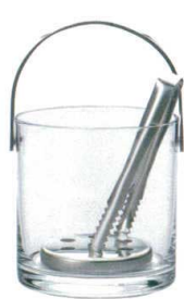
62869N トッカータ ¥5,200 12コ入 (1×12) φ121×H120・M125 ポリキャップ付吊手・目皿・トング (材質:ステンレス)日本製 49 06678 146032 ●