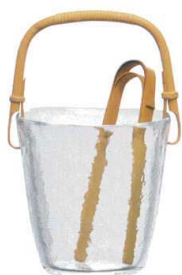
45565 高瀬川 ¥4,900 12コ入 (1×12) φ120×H120・M140 吊手・トング(材質:竹)日本製 49 06678 756279 ●