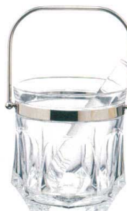
56176 フルース ¥1,900 12コ入 (1×12) φ130×H135・M145 吊手 (材質:ステンレス)、 目皿 (材質:ポリスチレン樹脂)、 トング(材質:アクリル樹脂)日本製 49 06678 046264