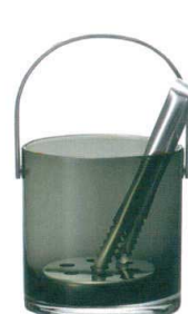
62869RSM-N フィンランディア ¥5,400 12コ入 (1×12) φ121×H120・M125 ポリキャップ付吊手・目皿・トング (材質:ステンレス)日本製 49 06678 146025 ●