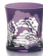
LS19551SP-C578 タンブラー(源氏雲げんじくも) ¥10,000 12コ入(1×12) φ84×H87・M84 270ml (101×108×98) 49 06678 146803 ●