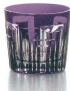
LS19550SP-C575 オンザロック(香園こうえん) ¥8,000 12コ入(1×12) φ87×H78・M87 275ml (103×101×100) 49 06678 146773 ●