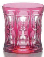
NLS19551SAU-C596 タンブラー(並籽ならびまね) ¥12,000 12コ入(1×12) φ84×H87・M84 270ml (101×108×98) 49 06678 152064 ●