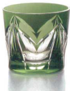
LS19550SCG-C577 オンザロック(矢羽根やばね) ¥8,000 12コ入(1×12) φ87×H78・M87 275ml (103×101×100) 49 06678 146797 ●