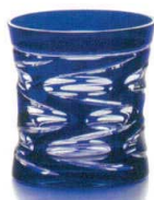
LS19551SULM-C579 タンブラー(水紋みずもん) ¥10,000 12コ入(1×12) φ84×H87・M84 270ml (101×108×98) 49 06678 146810 ●