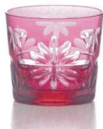
NLS19550SAU-C595 オンザロック(菱花ひしはな) ¥10,000 12コ入(1×12) φ87×H78・M87 275ml (103×101×100) 49 06678 152057 ●