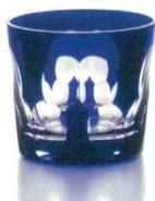
LS19550SULM-C576 オンザロック(統州浜つつきはま) ¥8,000 12コ入(1×12) φ87×H78・M87 275ml (103×101×100) 49 06678 146780 ●