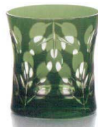
LS19551SCG-C580 タンブラー(向萩葉むかひはぎのは) ¥10,000 12コ入(1×12) φ84×H87・M84 270ml (101×108×98) 49 06678 146827 ●