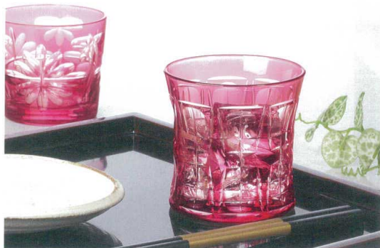
八千代切子焼酎シリーズに「金赤」(実際に金を用いて発色させた赤色)が加わりました。