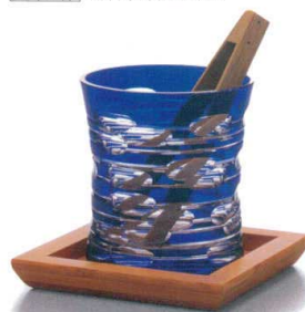
LS62600SULM-C527 氷入れ ¥18,000 6コ入(1×6) φ115×H122・M115 本体:日本製、竹製トレー・竹製トング:中国製 (157×170×106) 49 06678 133490 ●

下総の国、八千代で生まれた八千代切子。伝統の粋な柄に現代の感覚を取り入れた大胆で新しい風情の切子ぐらすをお楽しみください。「八千代の逸品」認定品