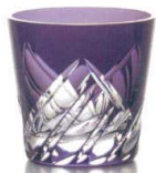
LS19601SP-C529 杯 (網代柄) ¥6,000 12コ入 (1×12) ☐ φ72×H68・M72 130ml (92×91×89) 49 06678 139379 ●