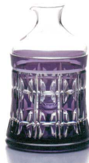
LS62610SP-C531 徳利 (格子柄) ¥20,000 6コ入 (1×6) φ38×H162・M97 270ml (145×227×111) 49 06678 139416 ●