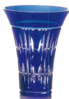
LS19600SULM-C528 杯 (格子柄) ¥6,000 12コ入 (1×12) ☐ φ72×H92・M72 110ml (92×92×113) 49 06678 139362 ●