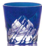
LS19601SULM-C529 杯 (網代柄) ¥6,000 12コ入 (1×12) ☐ φ72×H68・M72 130ml (92×91×89) 49 06678 139386 ●