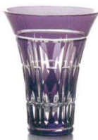
LS19600SP-C528 杯 (格子柄) ¥6,000 12コ入 (1×12) ☐ φ72×H92・M72 110ml (92×92×113) 49 06678 139355 ●