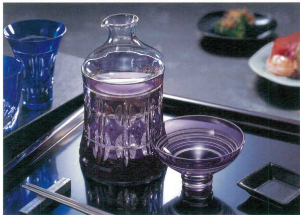
ハンドメイド レッドクリスタル24%PbO