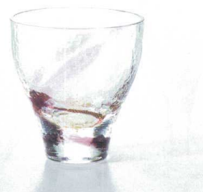
10495 タンブラー ¥5,000 24コ入 (1×24) φ84×H89・M84 230ml (108×108×103) 49 06678 150343 ●