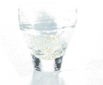
10492 タンブラー ¥5,000 24コ入 (1×24) φ84×H89・M84 230ml (108×108×103) 49 06678 150091 ●