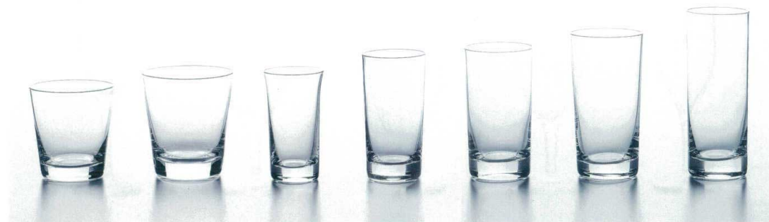
T-20105HS 7オールド ¥440 96コ入 (6×16) φ78×H83・M78 220ml 49 06678 133698