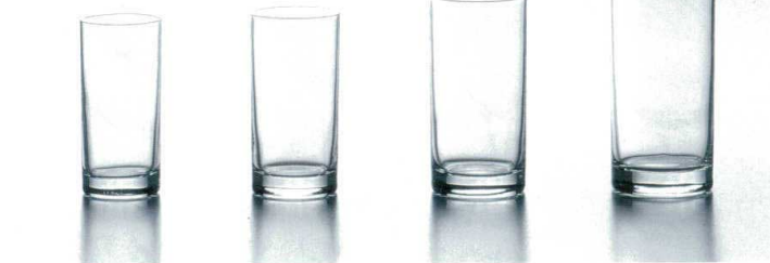
06406HS タンブラー ¥390 120コ入 (6×20) φ55×H110・M55 185ml 49 06678 798064