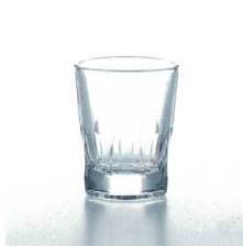
P-01105-E102 ショットグラス ¥750 144コ入 (12×12) φ50×H63・M50 60ml 49 06678 149156