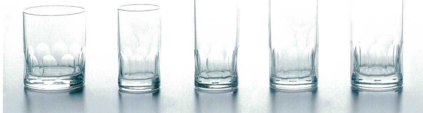
07116HS-E102 オンザロック ¥860 96コ入 (6×16) φ74×H88・M74 275ml 49 06678 129905