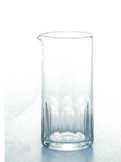
B-25404-E102 カラフェ ¥2,400 36コ入 (1×36) φ80×H170・M80 710ml 49 06678 140740