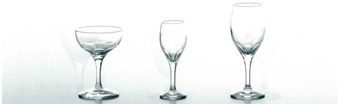
30G34HS-E102 シャンパン ¥1,400 60コ入 (6×10) φ84×H117・M84 135ml 49 06678 803690