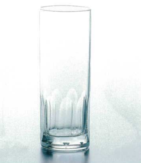
07113HS-E102 12ゾンビー ¥940 60コ入 (6×10) φ62×H164・M62 360ml 49 06678 139195