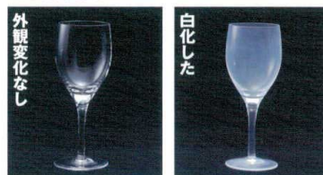
ファインクリスタル 24%鉛クリスタル