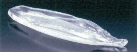
YA210 あゆ皿 ¥2,100 30コ入 (3×10) W300×D110×H15 49 33979 082417 ★