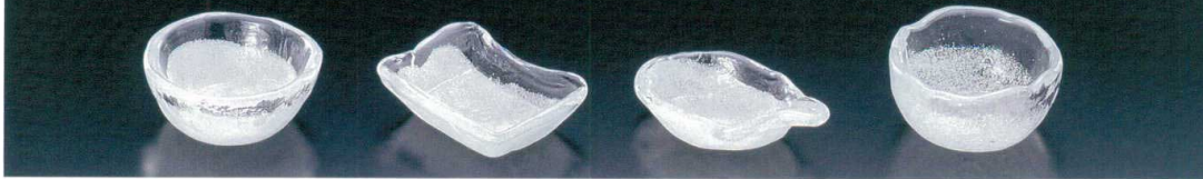
YA22 丸ちよこ ¥990 80コ入 (5×16) φ90×H40・M90 49 33979 080130 ★