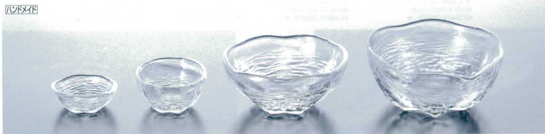
TK423-14 ちょこ ¥520 180コ入 (10×18) φ80×H30・M80 49 33979 080529 ★