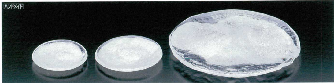
YA40 丸豆皿 ¥1,200 80コ入 (5×16) φ135×H20・M135 49 33979 080222 ★