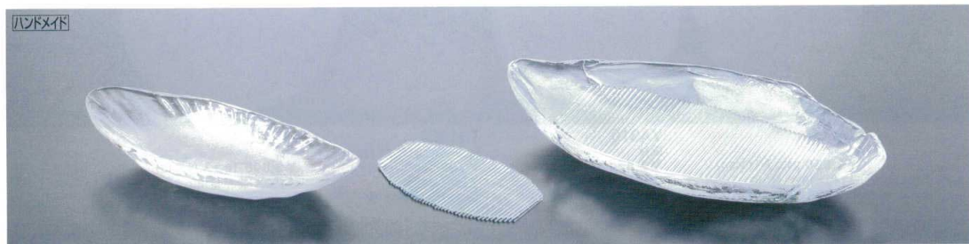
YA8 舟型中盛皿 ¥3,000 12コ入 (1×12) W380×D150×H60 49 33979 080031 ★