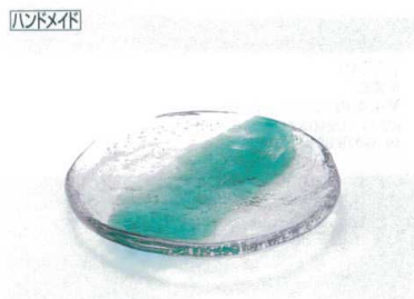
YA201-6 小皿 ¥1,700 60コ入 (5×12) ☐ φ165×H15・M165 49 33979 082400 ★