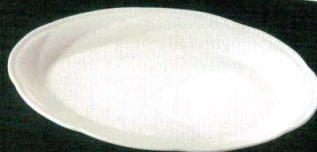
★ 995-062 10.5" プラター 26.7 × 18.8 × 2.7cm 2,200 円