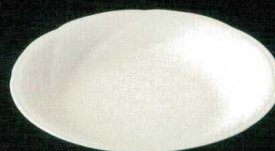
995-021 8.5" スープ φ22 × 4cm 1,030 円