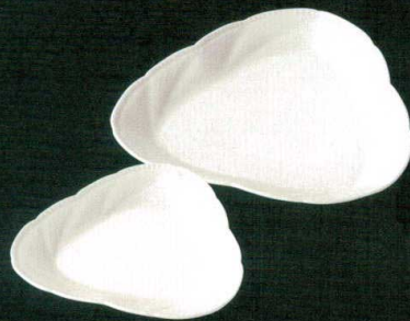
★ 995-308 三角皿 (小) 18.1 × 18.1 × 2.5cm 880 円