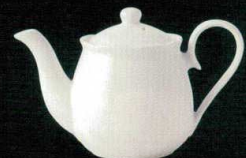
★ 995-080 2人用ポット 630cc 3,850 円