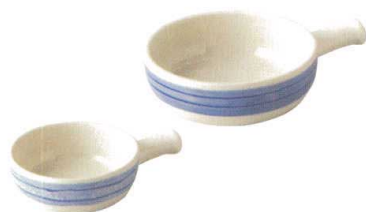
931-402 手付ボール(小) φ11.8×4.1cm 1,320円 931-401 手付ボール(大) φ15×4.8cm 1,600円