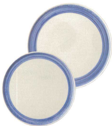
931-794 ピザプレート穴無し(小) φ28×1.6cm 3,130円 931-792 ピザプレート穴無し(大) φ31.8×1.8cm 4,500円