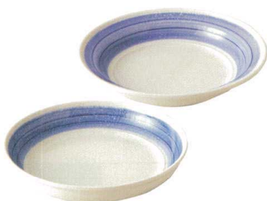
931-718 クープパスタ φ23.3×4.4cm 1,680円 931-719 リムパスタ φ23.8×4.5cm 1,680円