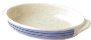
931-405 長グラタン 22.8×12.7×3.8cm 1,650円