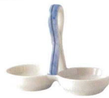
★931-917 オイル&ピネガー(台) φ19×14.5cm 1,500円