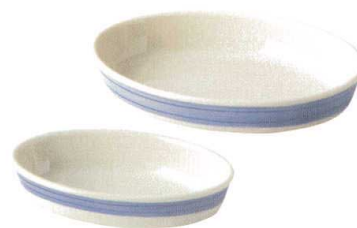
931-731 楕円グラタン(小) 19×11.6×4cm 1,430円 931-730 楕円グラタン(大) 23.1×15.3×4cm 1,870円