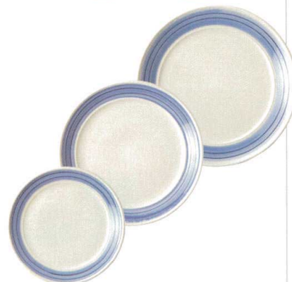
931-707 7.5" ケーキ皿 φ19×2.1cm 1,050円 931-709 9.5" ミート皿 φ23.5×2.5cm 1,430円 931-710 10.5" ディナー皿 φ26.7×2.9cm 1,800円