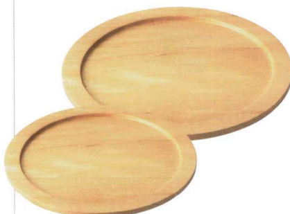
999-902 木台(小) φ29.6×1.9cm 3,170円 999-901 木台(大) φ35.6×1.6cm 6,100円