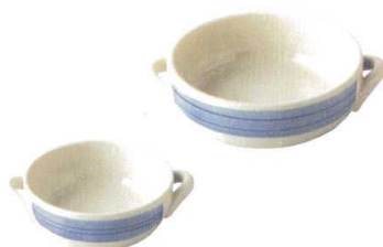
931-404 耳付丸グラタン(小) φ11.8×4.1cm 1,260円 931-403 耳付丸グラタン(大) φ15×4.8cm 1,430円