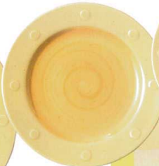
400-008 8" ライス皿 φ20.5×2.5cm 850 円