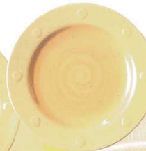
400-007 7" ケーキ皿 φ18.7×2.2cm 770 円