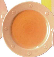
★403-008 8" ライス皿 φ20.5×2.5cm 780 円