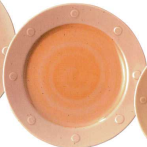
★403-010 10" ディナー皿 φ25.5×3cm 1,550 円