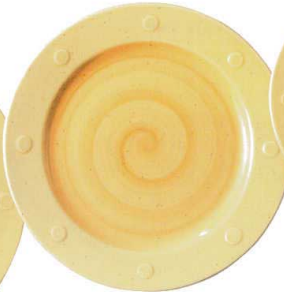
400-010 10" ディナー皿 φ25.5×3cm 1,700 円