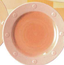
★403-007 7" ケーキ皿 φ18.7×2.2cm 700 円