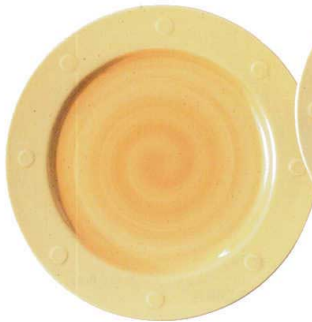
400-011 11" ディナー皿 φ27.8×3cm 1,920 円