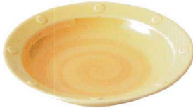
400-719 リムパスタ φ24×4.1cm 1,370 円