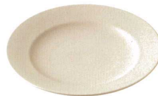
★ 743-F111 11" リムプレート φ28 × 3.8cm 2,200 円