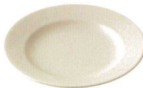
★ 743-F110 10" リムプレート φ25.2 × 3.6cm 1,650 円