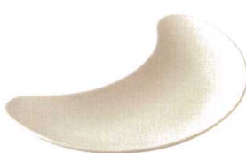
★ 743-F058 三日月プレート(大) 24.8 × 12 × 2.7cm 1,650 円