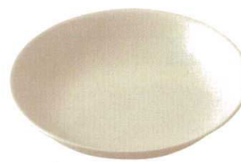
★ 743-F022 9" スープ皿 φ23 × 4.7cm 1,280 円