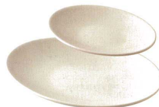
★ 743-F054 オーバルプレート(小) 18 × 12.5 × 2.4cm 880 円