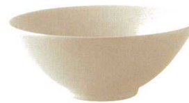
★ 743-F020 サラダボール φ23 × 9.2cm 1,780 円