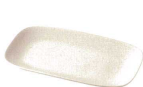
★ 743-F069 焼き物皿 22 × 12.8 × 2.4cm 1,200 円