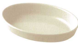
★ 743-730 楕円グラタン(大) 23 × 15.3 × 4cm 1,750 円