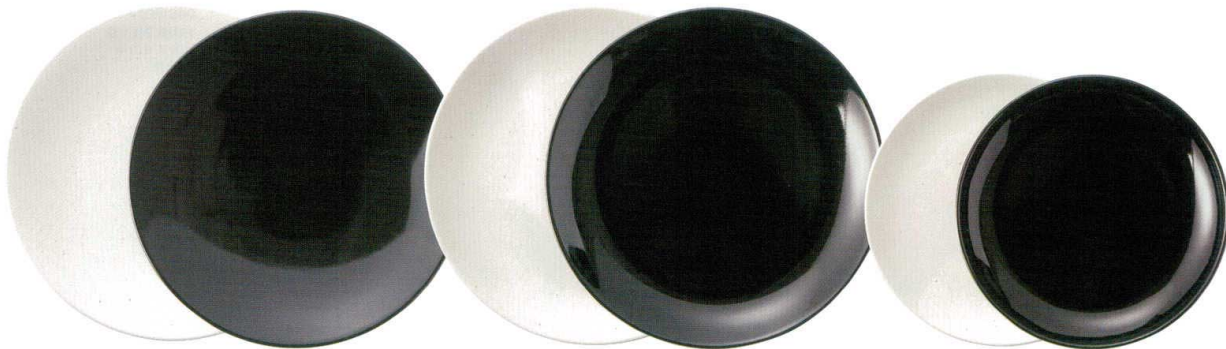
浅形尺二皿 φ38.5×4.6cm □184-Q009……………5,800円 ■185-Q009……………5,800円