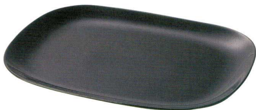
丸角大皿 38×27.5×2.7cm □184-0062……………4,800円 ■185-0062……………4,800円