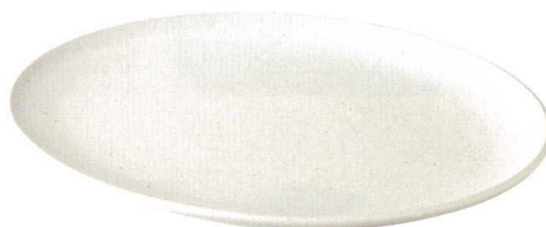
楕円大皿 38.5×29×2.5cm □184-0061……………4,800円 ■185-0061……………4,800円