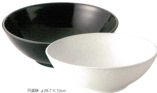
尺盛鉢 φ29.7×10cm □184-0065……………6,000円 ■185-0065……………6,000円