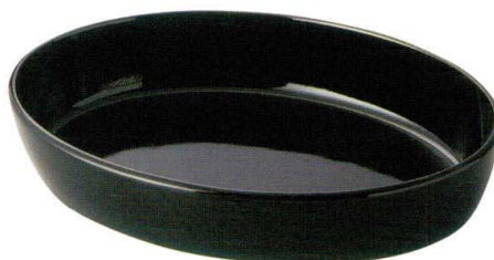
楕円盛鉢 31.8×23.3×5.7cm □184-0063……………5,200円 ■185-0063……………5,200円