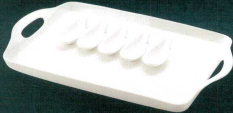
331-W117 ピュッフェスプーン 12 × 4.7 × 3.1cm 350 円