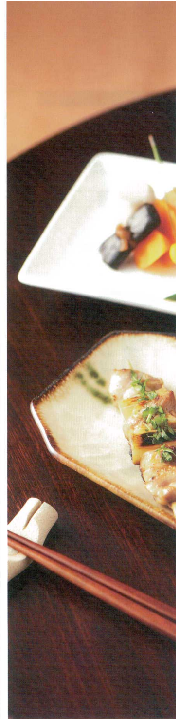
450-A510 さわらび八角型多用皿 24×15.5×2.8cm 1,260円