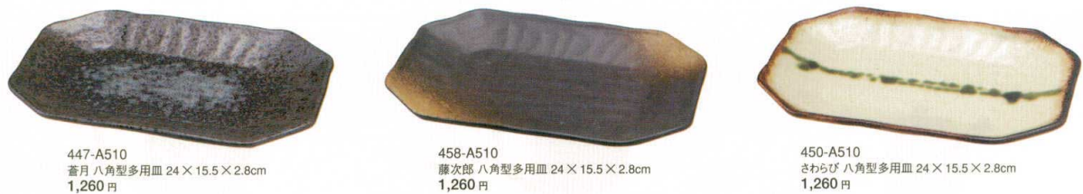
447-A510 蒼月八角型多用皿 24×15.5×2.8cm 1,260円