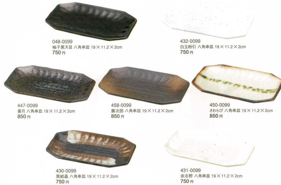
048-0099 柚子黒天目八角串皿 19×11.2×2cm 750円