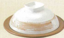
フタ 白樟 × 陶板 薄茶陶板丸