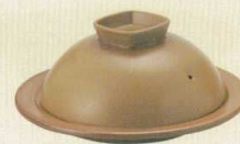
フタ 薄茶 × 陶板 薄茶陶板丸