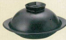
フタ 黒マット × 陶板 黒陶板四角