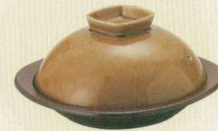
フタ 鉛斑点 × 陶板 茶陶板四角