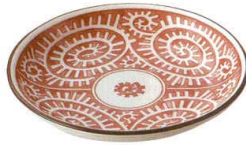
132-M001 4寸皿 φ12.9×2.1cm 450 円