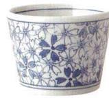
133-E045 そば千代口 φ8×6cm 170cc 540 円