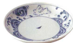
134-M001 4寸皿 φ12.9×2.1cm 450 円