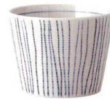
135-E045 そば千代口 φ8×6cm 170cc 540 円