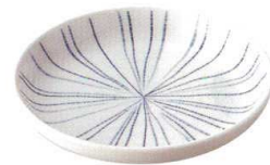
135-M001 4寸皿 φ12.9×2.1cm 450 円