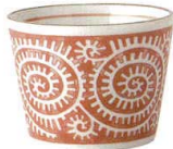
132-E045 そば千代口 φ8×6cm 170cc 540 円