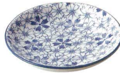
133-M001 4寸皿 φ12.9×2.1cm 450 円