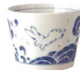
134-E045 そば千代口 φ8×6cm 170cc 540 円