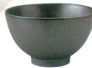
456-F066 茶漬碗 φ13 × 7.8cm 820 円