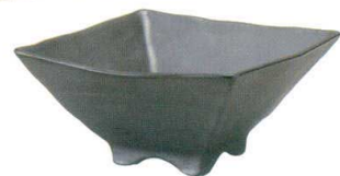
456-0017 7.0 盛鉢 φ21.0 × 20.5 × 10cm 2,800 円