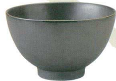
456-F065 五寸多用丼 φ15.2 × 9cm 1,150 円