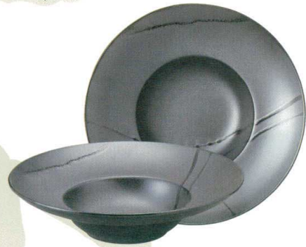
456-X022 28cm スープ φ24 × 6.1cm 3,000 円