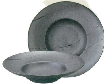
456-X021 24cm スープ φ28 × 6.1cm 2,080 円