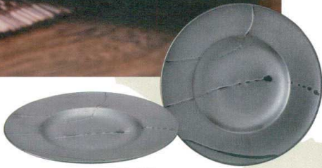
456-1094 20cm プレート φ20 × 2.7cm 900 円