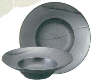
456-1095 21cm スープ φ21 × 5.7cm 1,300 円