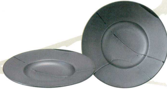
456-X009 24cm プレート φ24 × 2.3cm 1,380 円