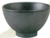
456-F067 飯碗 φ11.4 × 7cm 630 円