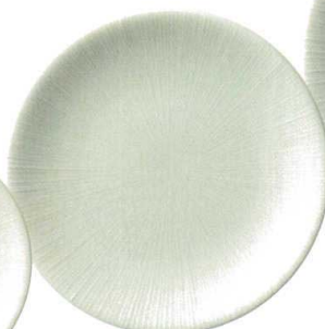
187-0002 7.5皿 φ23.7×3.4cm 1,400円