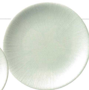
187-0001 尺皿 φ30.5×4.3cm 3,600円