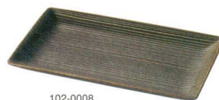
102-0008 焼物皿 23.8×13.5×2.5cm 1,400円