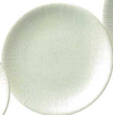
187-0003 5.5皿 φ18×2.6cm 1,000円