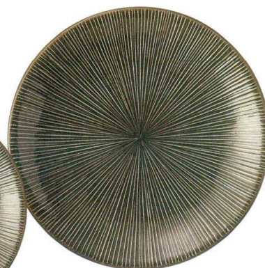
102-0001 尺皿 φ30.5×4.3cm 3,600円