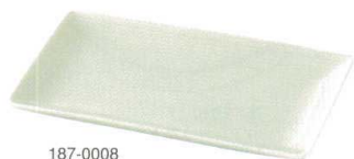
187-0008 焼物皿 23.8×13.5×2.5cm 1,400円