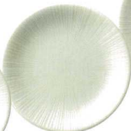
187-0004 4.5皿 φ15×2.2cm 700円