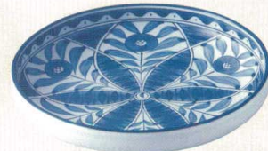
★ 030-E056 9.0浅鉢 φ27.7×5.3cm 3,450 円