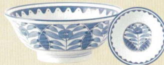
030-E027 6.8高台井 φ21.2×8.3cm 1,150 円