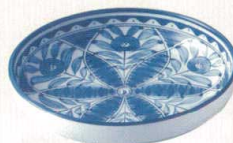
★ 030-E032 7.0浅鉢 φ21.7×4.3cm 1,300 円