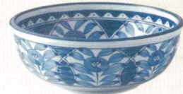
030-Q013 7.0ボール φ22.2×8cm 2,760 円