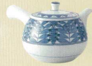
★ 030-E036 丸急須 16.8×11.8cm 360cc 2,250 円