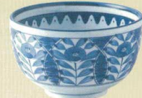
030-E075 5.1多用井 φ15.4×9.5cm 1,630 円