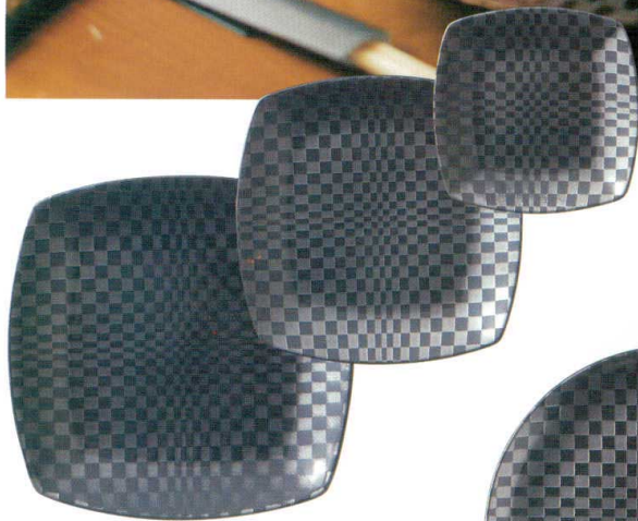
036-E060 四角小皿 14 × 14 × 2cm 970 円 036-E059 四角中皿 19.3 × 19.3 × 2.3cm 1,630 円 036-E058 四角大皿 23.2 × 23.2 × 2.8cm 2,640 円