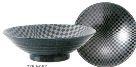
036-E057 8.0 めん鉢 φ 24.5 × 7.5cm 1,470 円