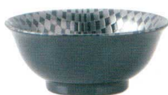
036-E026 6.3 高台丼 φ 18.5 × 7.8cm 1,100 円