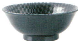
036-E027 6.8 高台丼 φ 21.2 × 8.3cm 1,320 円