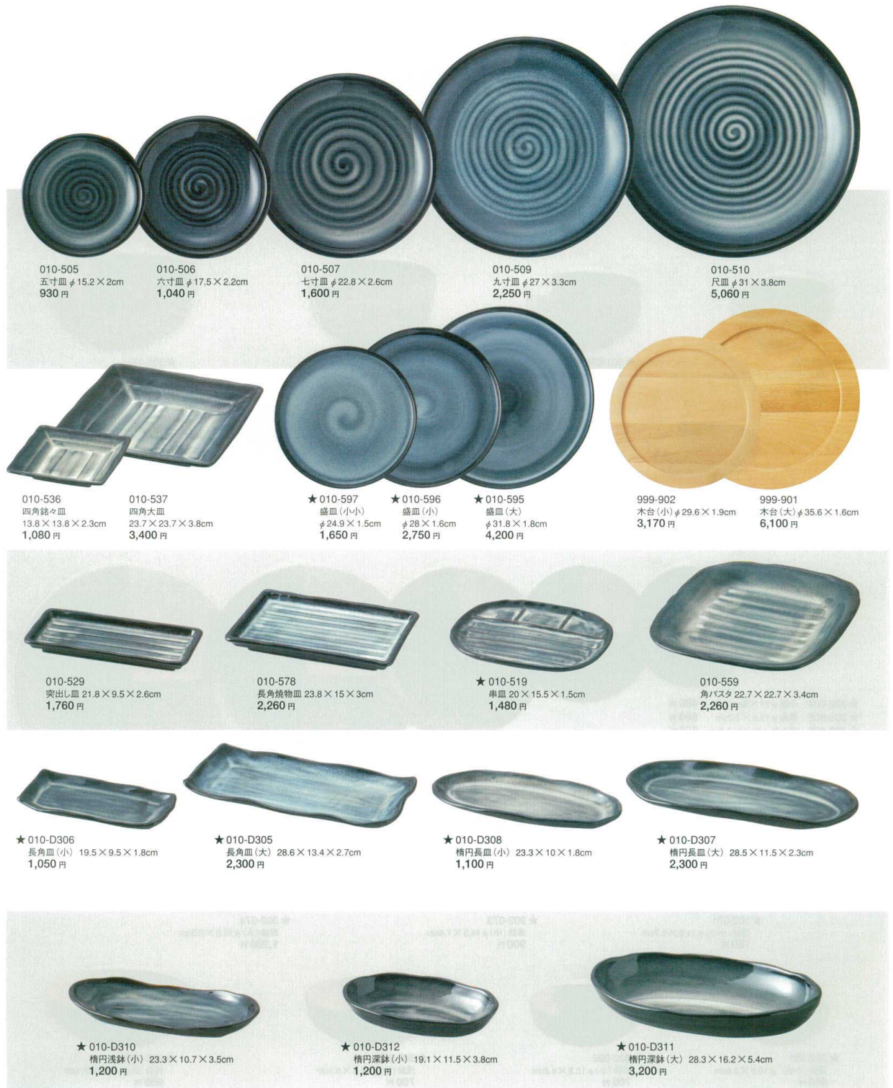
010-505 五寸皿 φ15.2×2cm 930 円