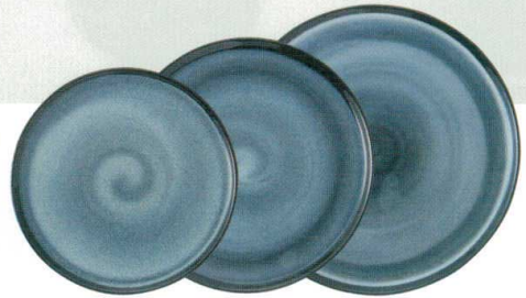
★010-597 盛皿(小小) φ24.9×1.5cm 1,650 円