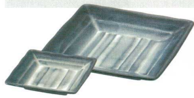
010-536 四角鉢々皿 13.8×13.8×2.3cm 1,080 円