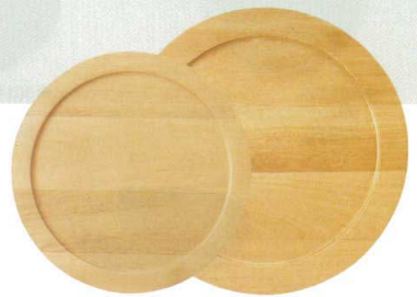
999-902 木台(小) φ29.6×1.9cm 3,170 円