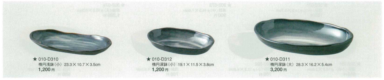
★010-D310 楕円浅鉢(小) 23.3×10.7×3.5cm 1,200 円