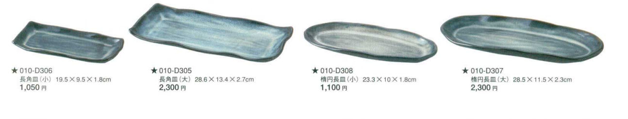
★010-D306 長角皿(小) 19.5×9.5×1.8cm 1,050 円