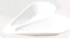
782-0128 SIZUKU アミューズスプーン (2ヶ) 16.7 × 15.1 × 2.4cm 900 円