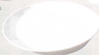
782-0130 SIZUKU プレート L φ24 × 4cm 1,800 円