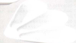
782-0129 SIZUKU アミューズスプーン (3ヶ) 22.2 × 17.7 × 2.4cm 1,200 円