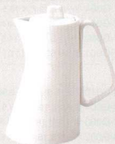
782-0132 SIZUKU ポット 14 × 9.5 × 15cm 520cc 3,400 円