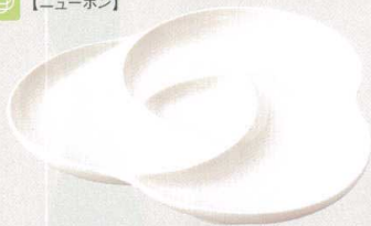
781-0125 KAKKO ピュッフェプレート M 26.4 × 25.2 × 2.7cm 2,100 円