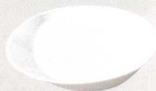
782-0131 SIZUKU プレート S φ16 × 2.8cm 800 円