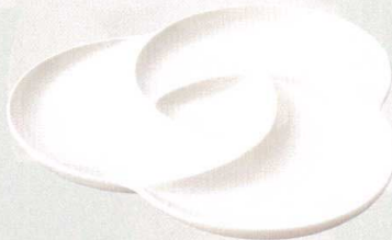
781-0124 KAKKO ピュッフェプレート L 28.3 × 27 × 2.7cm 2,400 円