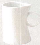
782-0134 SIZUKU マグ 10 × 8 × 10cm 260cc 1,060 円