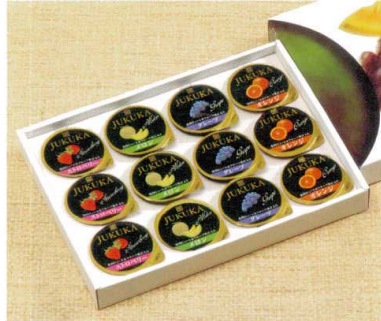
Z-73-01 70 231M17C60K62 ¥1,050 (本体価格¥1,000)

フルーツゼリーミックス (FM-10) ◇箱/24×32.5×4cm◇化粧箱◇個/10◇内容/熟果ゼリー(ストロベリー・オレンジ・グレープ・メロン)各63g×3個 ■販売期間:3月~8月