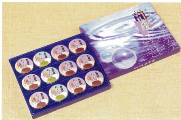
Z-73-06 70 231M17C60K62 ¥2,100 (本体価格¥2,000)

北海道メロン&九州メロンゼリー (M-30) ◇箱/34.8×38.5×3.5cm◇化粧箱◇個/8◇内容/北海道メロンゼリー63g×10個・九州メロンゼリー63g×10個 ■販売期間:3月~8月