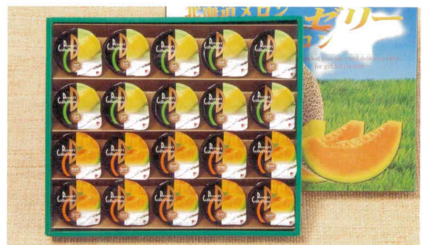
Z-73-05 70 231M17C60K62 ¥3,150 (本体価格¥3,000)

北海道メロン&九州メロンゼリー (M-20) ◇箱/26.5×31.2×3.5cm◇化粧箱◇個/12◇内容/北海道メロンゼリー63g×6個・九州メロンゼリー63g×6個 ■販売期間:3月~8月