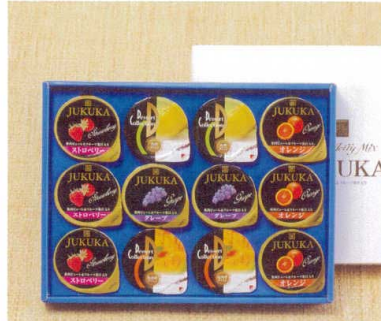
Z-73-02 70 231M17C60K62 ¥1,575 (本体価格¥1,500)

フルーツゼリーミックス (FM-10) ◇箱/24×32.5×4cm◇化粧箱◇個/10◇内容/熟果ゼリー(ストロベリー・オレンジ・グレープ・メロン)各63g×3個 ■販売期間:3月~8月