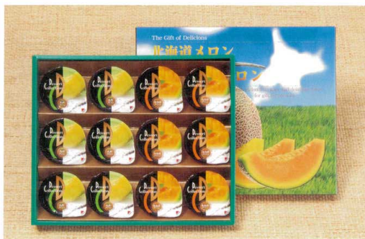
Z-73-04 70 231M17C60K62 ¥2,100 (本体価格¥2,000)

フルーツゼリーミックス (FM-20) ◇箱/27.5×38.7×5.6cm◇化粧箱◇個/6◇内容/ピーチゼリー125g×2個・パイゼリー125g×1個・北海道メロンゼリー63g×2個・九州メロンゼリー63g×2個・マンゴープリン63g×2個・葡萄ゼリー52g×2個 ■販売期間:3月~8月