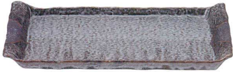
5051689 石目尺四平方皿 ¥9,500 L42 S27 H4.5