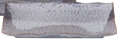
5051646 石目尺長角皿 ¥4,400 L31.7 S21.5 H3.5