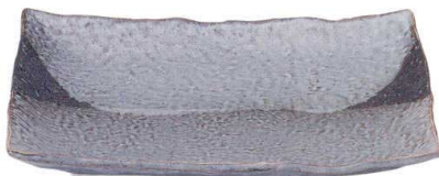
5051683 石目尺一盛皿 ¥5,500 L33 S27.8 H3.8