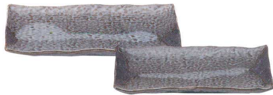
5051645 石目9.5長角皿 ¥3,700 L29 S19 H3