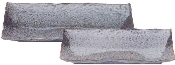
5051648 石目尺二長角皿 ¥5,800 L36.5 S24.3 H3.5