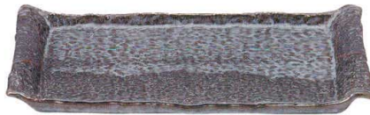
5051687 石目尺二平方皿 ¥6,900 L37.5 S22.3 H3.5