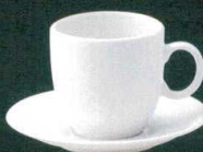
2000851 アメリカンカップ ¥650 L11.2 S8.3 H8(250cc) 2000655 兼用ソーサー ¥330 D14.5 H1.8