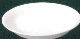
2000816 21.5cmスープバグティ ¥800 D21.5 H3.9