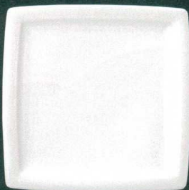
2000865 21cm正角皿 ¥2,400 D21 H2.3 ID17.5