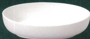
2000886 26cmシップベーカー ¥2,500 L26 S16.7 H6.5