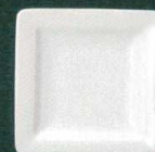
2000861 11cm正角皿 ¥1,200 D11 H1.9 ID8