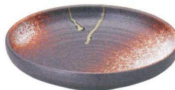
745 1580 石目尺盛鉢 ¥5,250 D31.5 H6