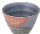
745 3173 リップル碗大 ¥800 D13.7 H7.5(490cc)