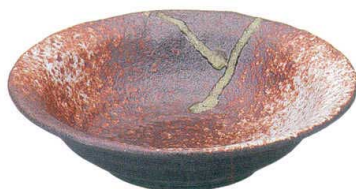
745 1563 石目リム尺鉢 ¥6,300 D31 H8.8