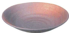
745 3109 リップル7.5皿 ¥1,050 D23.7 H4.4