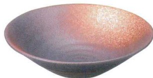
745 3159 リップル8.0鉢 ¥2,100 D26.2 H7