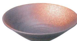
745 3157 リップル7.0鉢 ¥1,750 D23.2 H6.4