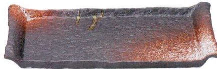
745 1687 石目尺二平角皿 ¥7,000 L37.5 S22.3 H3.5