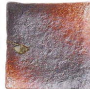
745 1662 石目5.0正角皿 ¥780 D15 H3