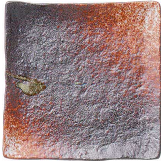
745 1668 石目9.0正角皿 ¥3,300 D27.5 H4.5