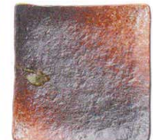
745 1660 石目4.3正角皿 ¥680 D13 H3