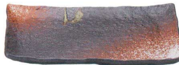
745 1683 石目尺一盛皿 ¥5,700 L33 S27.8 H3.8