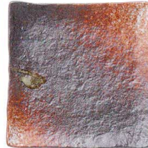
745 1663 石目6.0正角皿 ¥900 D17.5 H3.7