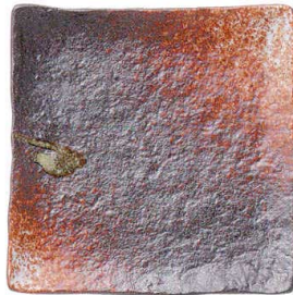
745 1665 石目7.0正角皿 ¥1,500 D22 H3.7