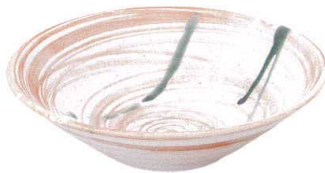
744 3159 リップル8.0鉢 ¥2,100 D26.2 H7