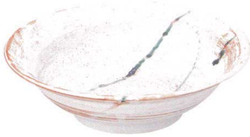
744 1563 石目リム尺鉢 ¥6,300 D31 H8.8