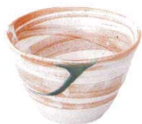
744 3173 リップル碗大 ¥800 D13.7 H7.5(490cc)