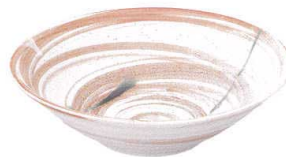
744 3157 リップル7.0鉢 ¥1,750 D23.2 H6.4