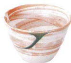
744 3171 リップル碗小 ¥600 D11 H7.3(310cc)