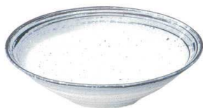
734 3159 リップル8.0鉢 ¥1,950 D26.2 H7