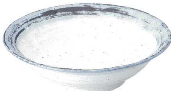
734 1563 石目リム尺鉢 ¥5,950 D31 H8.8