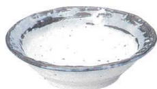
734 1555 石目6.0鉢 ¥800 D19.4 H4.8