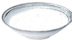
734 3157 リップル7.0鉢 ¥1,600 D23.2 H6.4