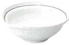
705 1758 なぶり大鉢 ¥1,900 D20.5 H8