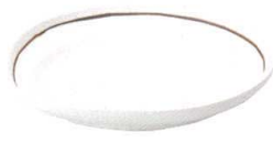
705 1706 なぶり6.0皿 ¥880 D20.3 H3.6