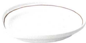
705 1708 なぶり7.0皿 ¥1,350 D23 H4