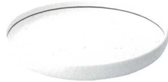
705 1580 石目尺盛鉢 ¥4,700 D31.5 H6