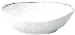
705 1572 石目楕円鉢 大 ¥3,200 L27.4 S19.7 H9.2