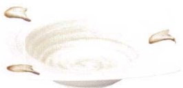
7613123 リップル24.5cm角ボール ¥3,650 D24.5 H6 ID16.5 IH3.5